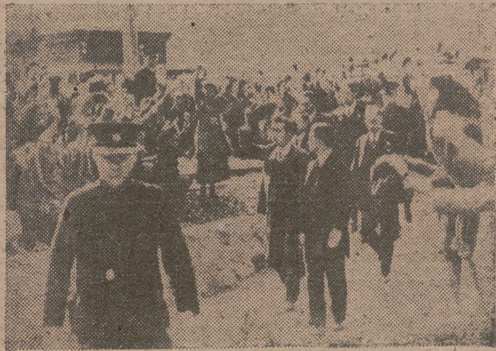
HITACHI (Japón). — El emperador del Japón, Hiro-Hito, corresponde a las aclamaciones de los habitantes de Hitachi, durante su visita a esta localidad, donde hizo una visita a las minas de carbón.