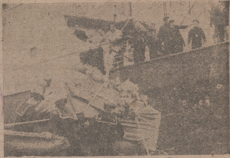
LA CORUNA. — Cubierto con la bandera nacional y flores, el féretro que contiene los gloriosos restos de don Eduardo Marquina, es desembarcado del «Marqués de Comillas», para trasladarlos al Ayuntamiento, donde se instaló la capilla ardiente. — (Foto Cifra).