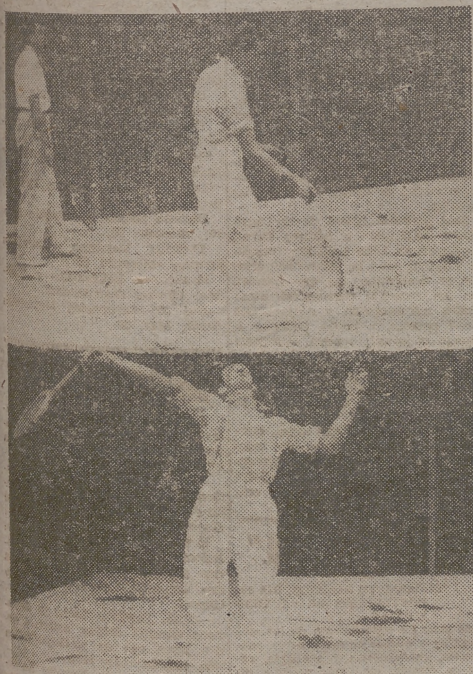
MEXICO. — «Manolete» se entrena físicamente para las próximas corridas y juega a la pelota en un frontón mexicano. Con la raqueta parece que no las da tan bien como con la muleta.