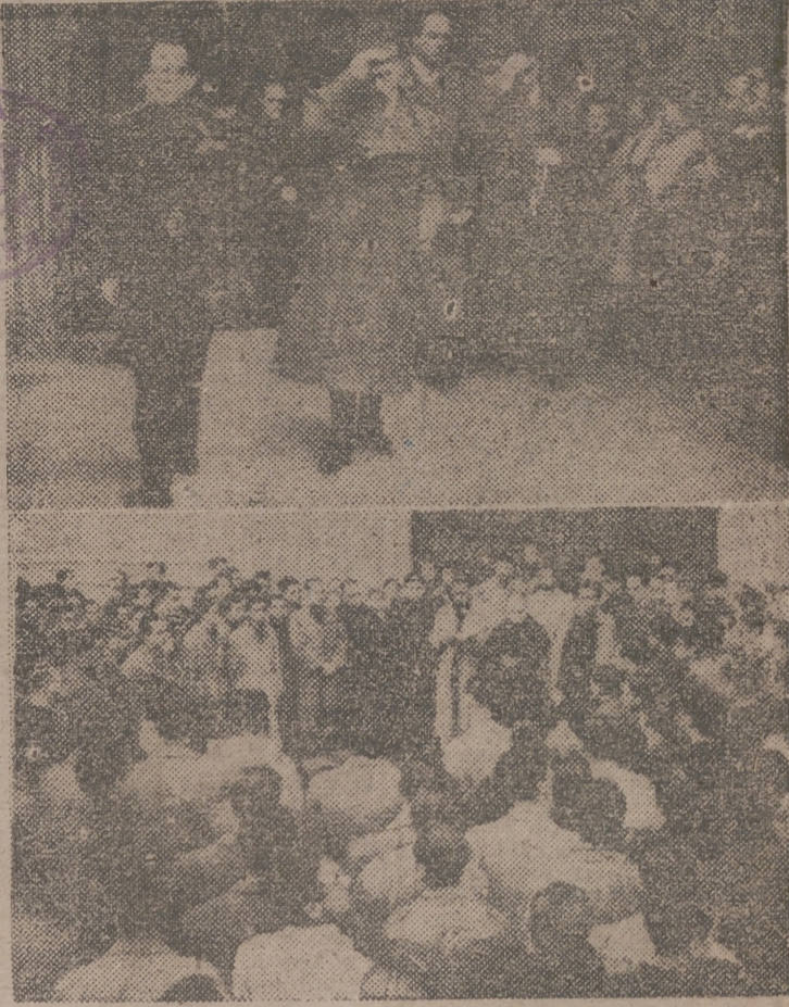
Las autoridades, al salir del funeral que se ha celebrado esta mañana en la Catedral. — Lectura de la Oración de los Caídos, a la salida de la misa que, por iniciativa del Frente de Juventudes, se ha celebrado en la iglesia de los Dominicos.