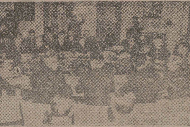
La foto muestra la mesa redonda con los delegados de los cuatro grandes.