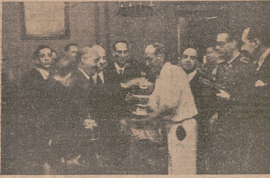
S. E. el Jefe del Estado, acompañado de distinguidas personalidades, presencia, desde el Club Náutico, las regatas de traineras.—S. E. el Jefe del Estado, entrega la copa al patrón de la trainera de los Sindicatos de Pesca de La Coruña, que resultó vencedora.