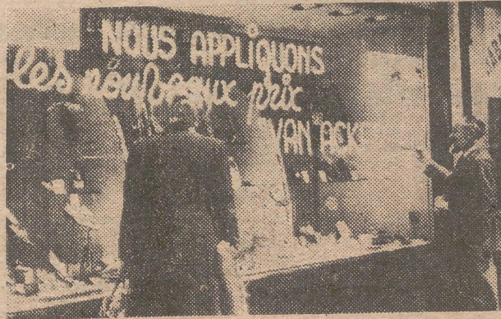
He aquí un escaparate de un comercio de calzado que anuncia los nuevos precios.

Bruselas, 7.—La reducción del diez por ciento sobre los precios de todo cuanto virtualmente puedan comprar y vender los belgas, impuesto hace unos diez días para contener la inflación, acabar con los mercados negros y evitar las nuevas peticiones de aumento de jornales, ha conseguido, cuando menos, el que este último objetivo se haya cumplido, según se anuncia en los medios bien informados.