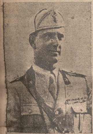
EL EX REY HUMBERTO

Nápoles, 7.—Una persona ha resultado muerta y seis gravemente heridas cuando unos manifestantes monárquicos arrojaron una bomba sobre un cuartel de carabinieri y atacaron además la iglesia de San Antonio con el propósito de agredir al cura párroco. Entre determinados elementos monárquicos existe la creencia de que el clero italiano no ha apoyado la causa de la Monarquía y esto ha dado lugar a algu-