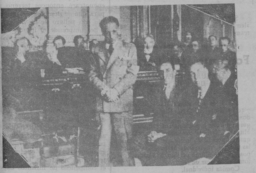
El ex-presidente de la Generalidad Sr. Companys, prestando declaración ante el Tribunal de Garantías

i cateva es una soll? Hala, dones, que va'l bolli! Just me queda el de la sort! Que d'aquell que compra a espera, vos envien a cobrar... i feis fart per la voltera que Lauren feta per passar? Que fano, per tot, conort, i vos enverga un argefol?... Hala, dones, que va'l bolli! Just me queda el de la sort! Que heu de mester la comate i cuant arriba, el nadó que ja cerr darrera la mare i heu llei amb un ta E6? Que heu de corre, per dissort, en tres calls i un ull-de-poll?... Hala, dones, que va'l bolli! Just me queda el de la sort! Preniu-ho tot en paciència i pensau que temps vendrà en que l'aigua, transparenta sense microbes tendrà: sense tifus, la Mort ja pot tira'l seu guizoll... Hala, dones, que va'l bolli! Just me queda el de la sort! Te'nurat aquell que veja sense estar de graçiat, els carrers nons, feu enveja al més lliis entrejolat; i ferem enmig de Cort una Font amb un bon broll... Hala, dones, que va'l bolli! Qui t'el treze té la sort! SALL