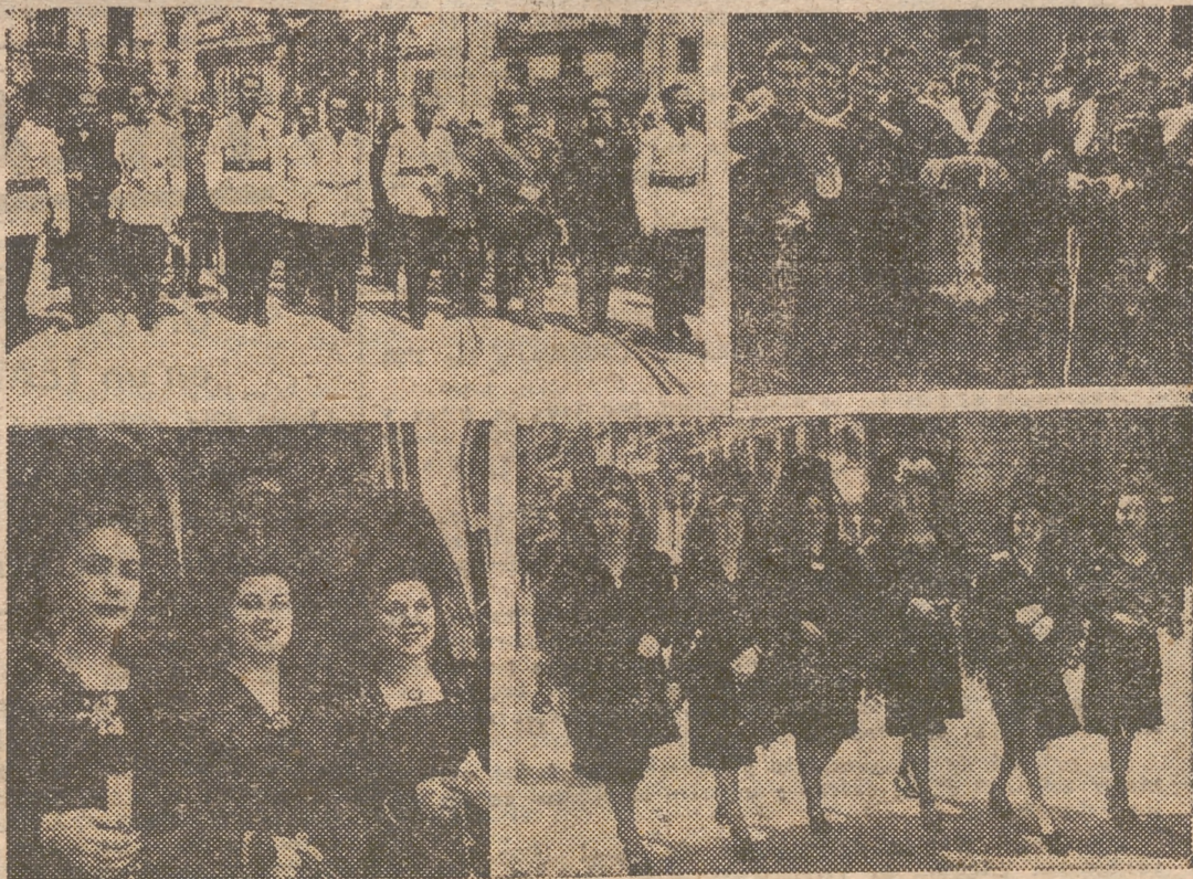
Las autoridades visitando los monumentos. — Su Excelencia el señor Obispo, a la salida de la Catedral. — Señoritas ataviadas con la típica mantilla española.