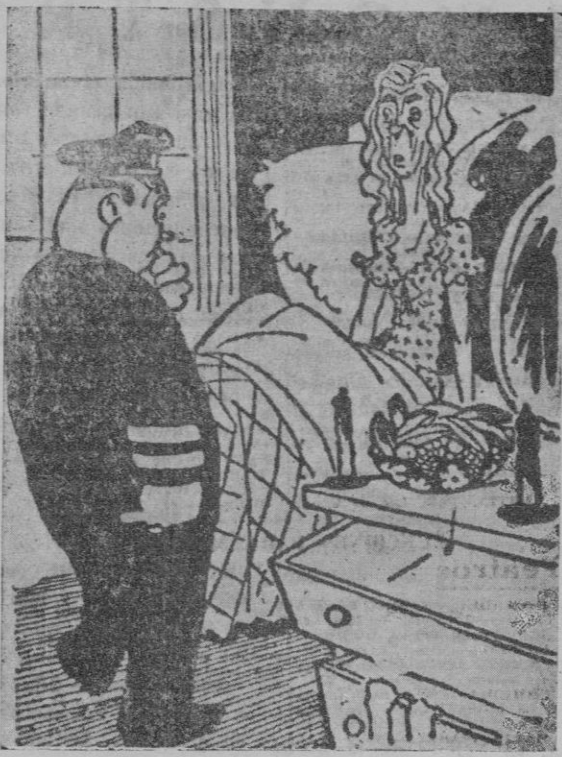
—Entonces me levanté de la cama, y el ladrón, al verme, lanzó un grito terrible y saltó por la ventana. —Me doy perfecta cuenta. (De "Smokhouse", de Nueva York)

gación, por si se complementaba con algún otro hallazgo de interés. Recordó la llamada sierra del Ducado, siguiendo el curso del río Salado, hasta dar con su nacimiento, a diez kilómetros de Santa María del Espino. El manantial del río está en una cueva.