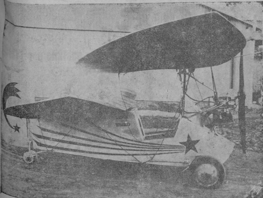
Avioneta Mignet construida en la Escuela Elemental de Traba- jo, de esta ciudad, por los alumnos de al mi ama; costada y di- rigida por el Marqués de Zayas

LA ALMUDAINA de hoy consta de diez páginas