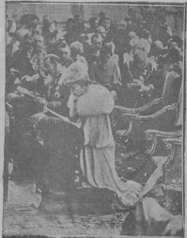
El jubileo del reinado de los Reyes de Inglaterra. — Los Reyes arrodillados durante el oficio religioso de acción de gracias, en la Catedral de San Pablo

Por la traducción: L. MUÑOZ LAVISTA Barcelona 5-III-34.