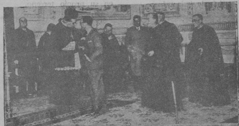
El ex-Obispo de Ibiza P. Silvio Huix al ser felicitado por su to- ma de posesión del Obispado de Lérida