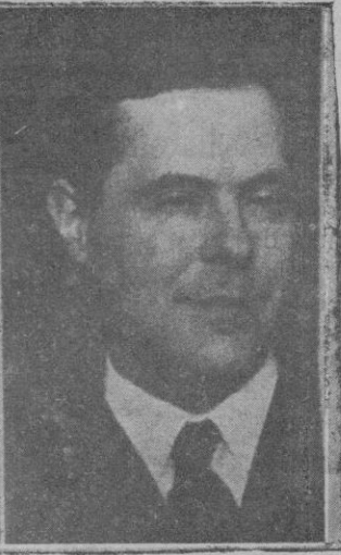
Ministro de Trabajo Don Federico Salmón