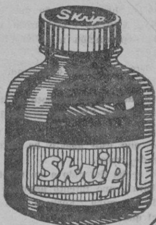
SKRIP, el Sucesor de la tinta, hará que su pluma escriba mejor.