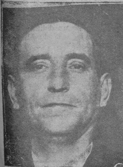
Don Luis Luca Ministro de Comunicaciones