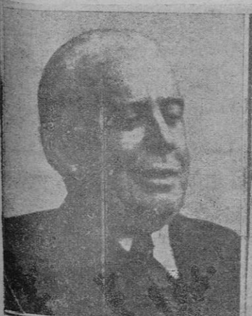
Don Joaquín Chapaprieta Ministro de Hacienda