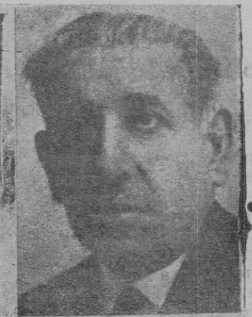
Don Nicéforo Velasco Ministro de Agricultura