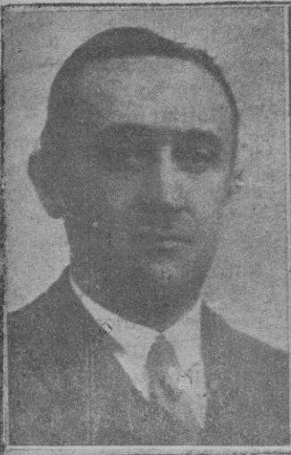
Don Cándido Casanueva Ministro de Justicia