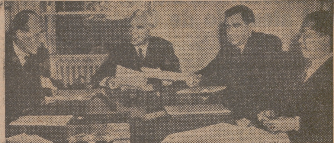
Con el secretario norteamericano de Estado, Edward R. Stettinius, se encuentran reunidos lord Halifax, inglés; Andrei Gromyko, ruso, y el doctor Wei Tao-Ming, chino, embajadores de sus respectivos países en los Estados Unidos, preparando la conferencia de San Francisco. — (Foto recibida por radio)