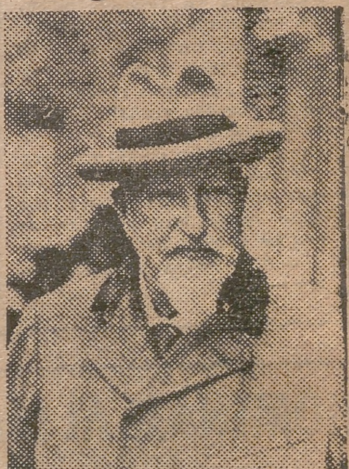
El ex rey Fernando de Bulgaria, que ha muerto víctima de un accidente de automóvil