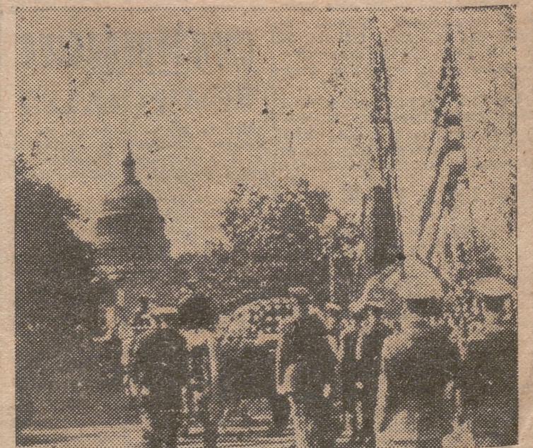
El féretro que encierra los restos del difunto presidente, es trasladado de la estación de Washington al Capitolio. (Foto recibida por radio)