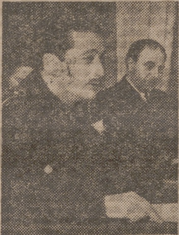
El secretario local de Falange Española Tradicionalista y de las J. O. N. S., durante su conferencia de ayer

Da término a su brillante disertación, afirmando que frente a todas las dificultades, riesgos y componendas circunstanciales, la Falange seguirá firme en esta em-