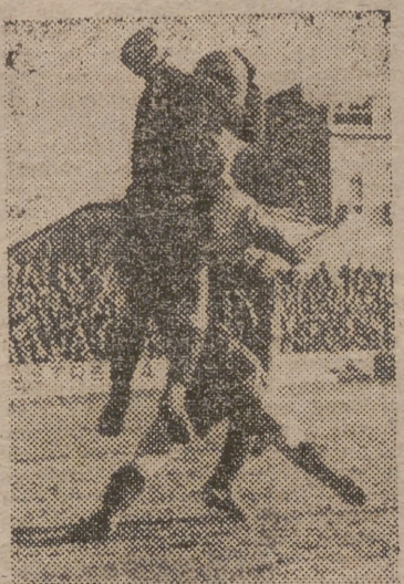
Una eficaz intervención del meta reusense