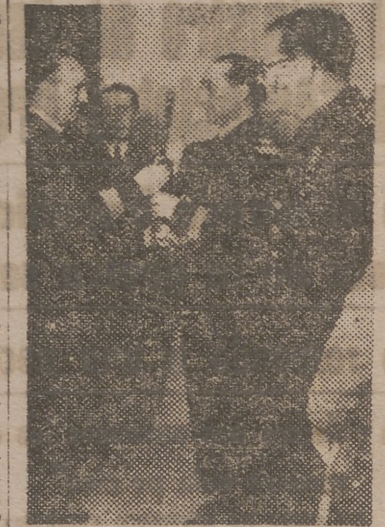
Momento de la entrega, por el señor Sánchez Díaz, de un bastón de mando al jefe superior de Policía

tos de mando que se le entregaban al Jefe Superior patentizaban el cariño y compañerismo de la promoción, estimándole para que honrara tales atributos y no se apartara nunca del cumplimiento de su deber. En su vibrante y elocuente discurso fué muy aplaudido.