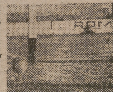
La jugada que le valió al Reus su único gol. Va chutó desde lejos, y Crespo, aunque tocó la pelota, no pudo evitar el tanto.