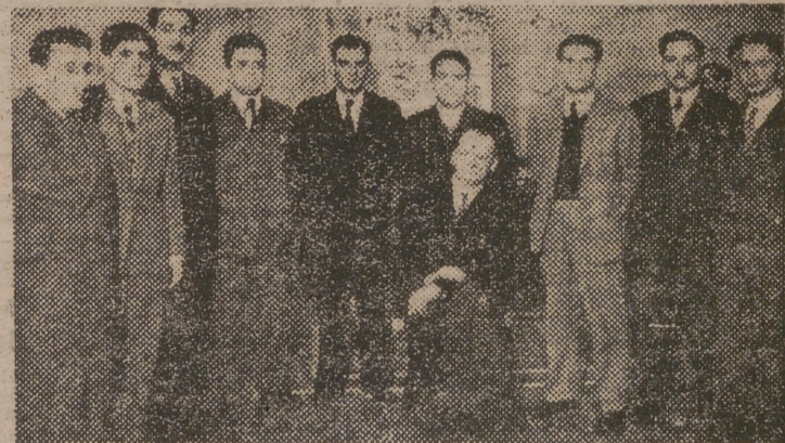
Ajedrecistas valencianos que consiguieron derrotar o hacer tablas con el campeón mundial señor Alekhine