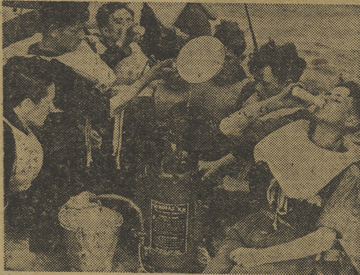
El alambique K. M. en un bote salvavidas

A todas esas invenciones que añaden hoy el alambique K. M., que ha servido para alejar de las aventuras naufragos el espeluznante prospecto de la sed.