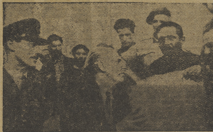
El primer ministro griego Papandreu, ayuda a descargar el primer saco de harina recibido por la población de Atenas de manos aliadas.

Londres, 15. — El Ministro de Estado, Richard Law, ha informado a la Cámara de los Comunes, en respuesta a una pregunta, que la llegada del Archiduque, Otto a Portugal no implica un apoyo político británico a la causa de los Habsburgos en Europa central. La actitud del Gobierno británico respecto a Austria — dijo — es la que contiene la declaración de Moscú del primero de noviembre de 1943; es decir, una Austria libre e independiente.