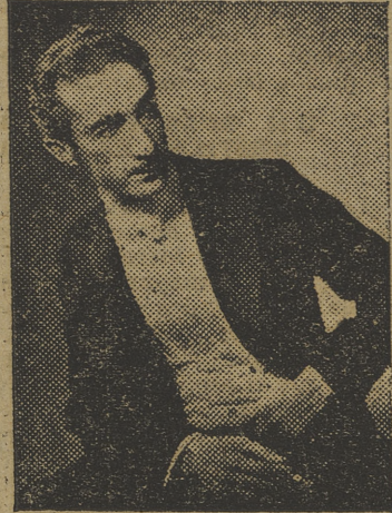
Regino Sainz de la Maza

este artista que es Sainz de la Maza. Sobre sus rodillas, la guitarra