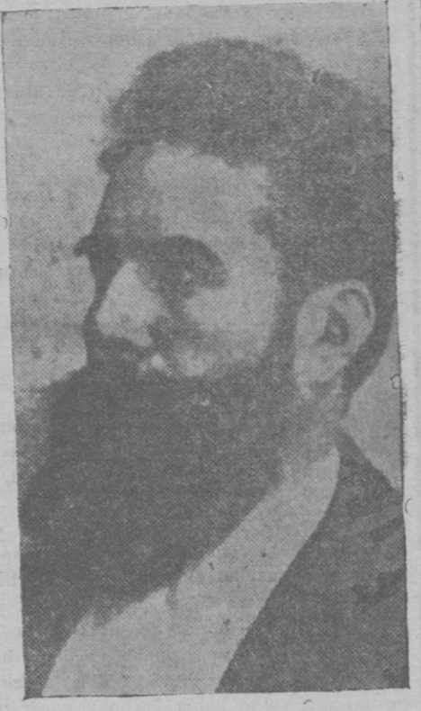
Konrad von Röntgen, descubridor de los rayos X, cuyo noventa cumpleaños se conmemoró ayer.