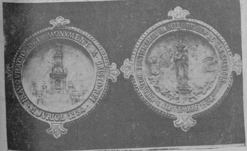
Medallones en bronce, recuerdo de la inauguración del monumento a Cristo-Rey y la coronación pontificia de la Virgen de San Salvador (Felanitx), originales del escultor Sr. Vila

La Guardia civil del puesto de Felanitx ha denunciado al señor Gobernador que en un café del suburbio de Porto-Colom se juega a los prohibidos, habiendo sido sorprendida el sábado última una partida, incautándose la fuerza de la cantidad de 2440 pesetas que encontraron sobre la mesa de juego. El Gobernador ha impuesto una multa de doscientas cincuenta pesetas al dueño del café, ordenando la clausura del establecimiento durante quince días, multándose también con veinticinco pesetas a cada uno de los cinco jugadores denunciados. La cantidad incautada ingresará en los fondos de la Junta Provincial de Protección de Menores.