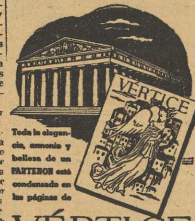
Toda la elegancia, armonía y belleza de un PARTENON está condensada en las páginas de

Y estas son las últimas noticias, hasta ahora, sobre la futura e inevitable invasión aliada.