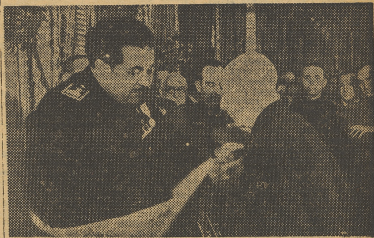
El Ministro del Trabajo en el acto de imponer las Medallas del Trabajo a los ferroviarios en el domicilio de la RENFE