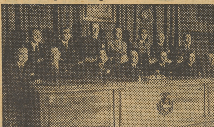
Esta mañana ha tenido lugar la apertura del Pleno de la Junta nacional de Colegios de Agentes Comerciales.