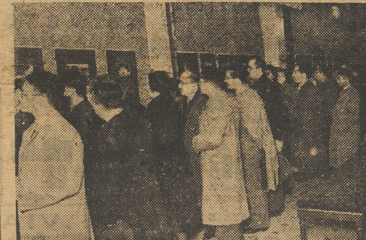
En los locales de la Asociación de la Prensa ha sido inaugurada una exposición de fotografías en color, que está siendo visitada por numeroso público.