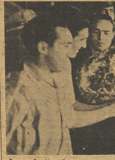
Las señoritas Laporta reciben, de manos de los capitanes, sendos ramos de flores

Empezó jugando bien el Valencia, entendiéndose sus líneas, pero la racha —por desgracia— sólo