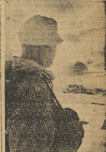
Un soldado de cazadores de montaña alemán, vigila las posiciones enemigas, no muy alejadas de las propias.