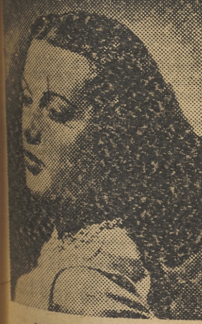
CHARLES BOYER y HEDY LAMARR

...tagias sensuales, constituye la esencia de la película. Y colocado en este ambiente es de presumir que la cual ha de ser el sabor del film de densidad.