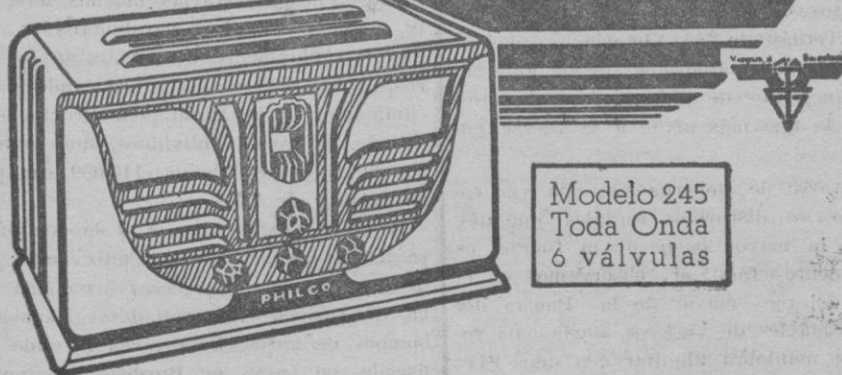
Modelo 245 Toda Onda 6 válvulas

Los dos valores que distinguen a los nuevos receptores PHILCO