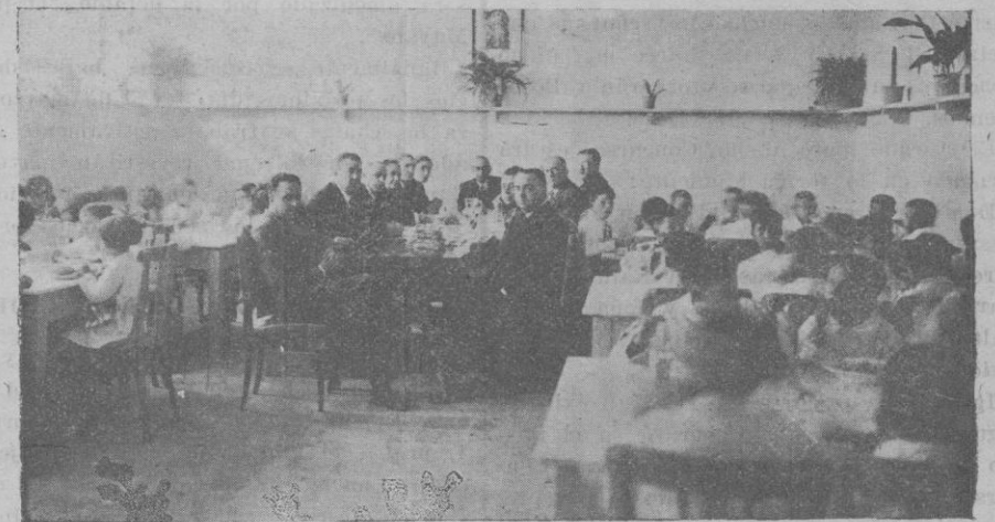
Comida de autoridades y colonos