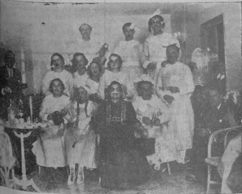
Comparsa de máscaras grotescas que asistió al baile celebrado ayer en el Lawn-Tennis Club