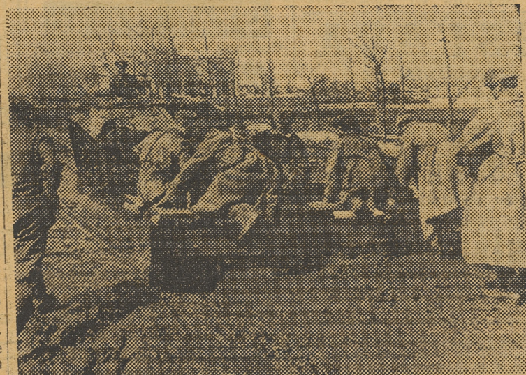
Para limpiar el barro en los caminos próximos a las poblaciones, es utilizado un tanque con un aparato de maderera que arrastra el barro hacia las orillas.