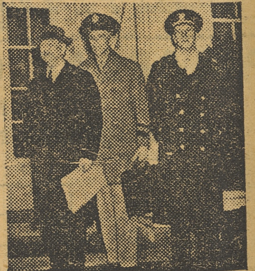
KNOX, CON EL GENERAL MARSHALL Y EL ALMIRANTE KING

Ahora bien: los submarinos se construyen con gran rapidez mientras que un barco como el portaviones, y más de aquel desplazamiento, todo lo más pronto que podría estar acabado es a fines del año que viene. Y mientras tanto, la batalla del Atlántico continúa implacable.—J. S.