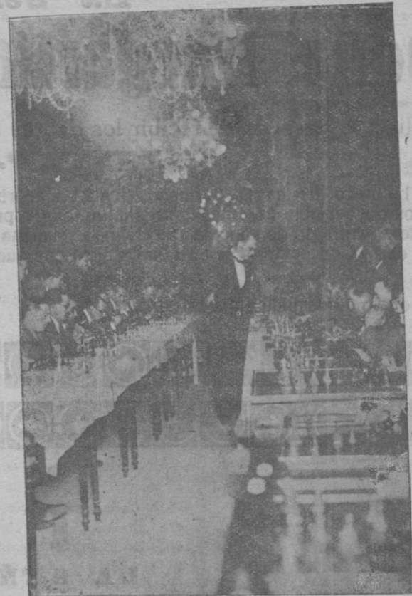
El campeón de ajedrez Sr. Alekhine en una jugada an- teanoche en el Círculo Mallorquín