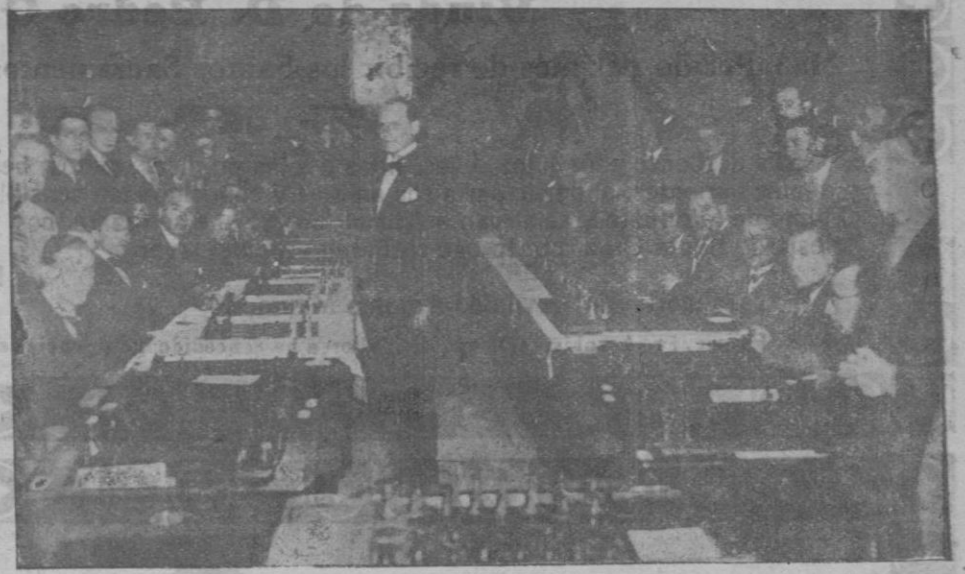
En los salones del Círculo Mallorquín. — El campeón mundial de ajedrez se- ñor Alekhine que jugó anteanoche contra 40 jugadores mallorquines

Escaleras del Metro a 8'00 Picas para Lavar a 20'00 Calle Morey, 16, Palma