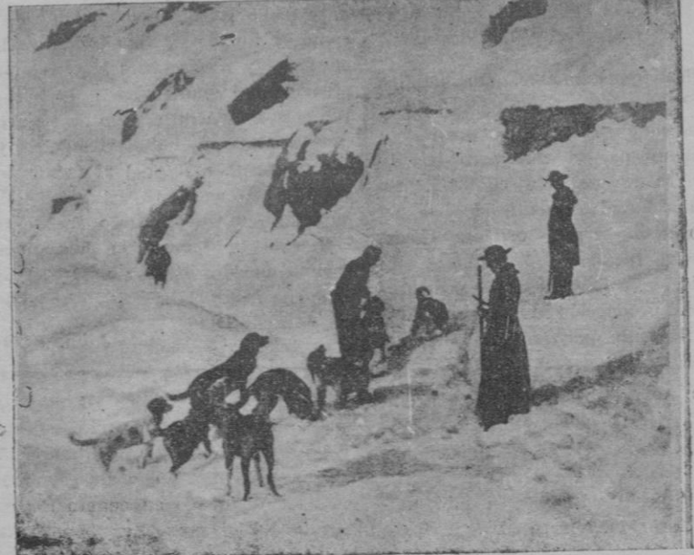
Monjes de San Bernardo (Suiza) poniendo a sus perros sobre la pista de cuatro viajeros que fueron arrastrados por un alud de nieve. Tres de ellos fueron hallados con vida y salvados por los perros

cada — poesía y ternura que tienen una dulce emoción y unos vagos sueños de amor — y en el "hall" del lujoso con su stavío oriental, su pelo azabache y el amarillo de su cutis, mientras fuma cigarrillos americanos, sus uñas metálicas — de ultra elegancia de la supercivilización — mesugiere la inevitable imagen del sinbólico Dragón Sagrado, y la danza embrujada de misterio, en la que Anna May Wong, al encarnar su espíritu, se substra-