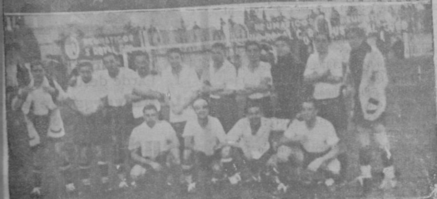
Del partido de futbol de ayer. — Arriba: El equipo del F. C. Wien. Abajo: la selección mallorquina a base de los equipos Constanca, Mediterráneo y A letic