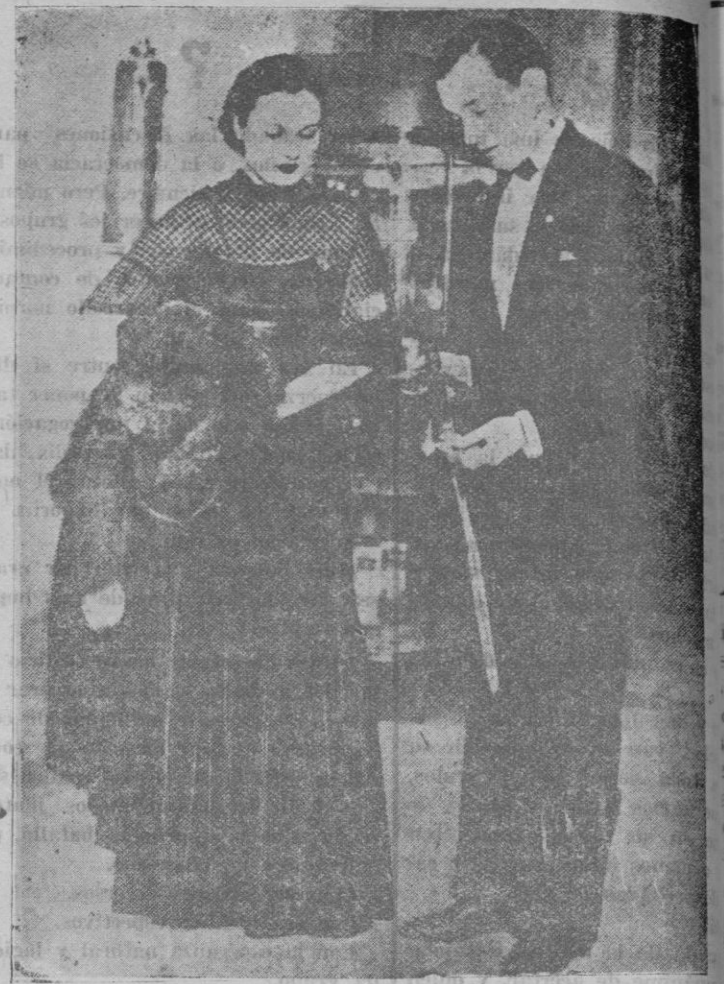
El ex-alcalde de Toledo (EE. UU.) Jimmy Walker con su esposa durante su visita a Toledo. Este matrimonio visitará uno de estos días nuestra población.

La receptividad general para contraer el sarampión y el hecho de ser contagioso precisamente durante los primeros días, antes de que los enfermos estén encamados, hace extraordinariamente difícil orientar la profilaxia pública en el sentido de disminuir el número total de contagios a largo plazo en una circunscrip-