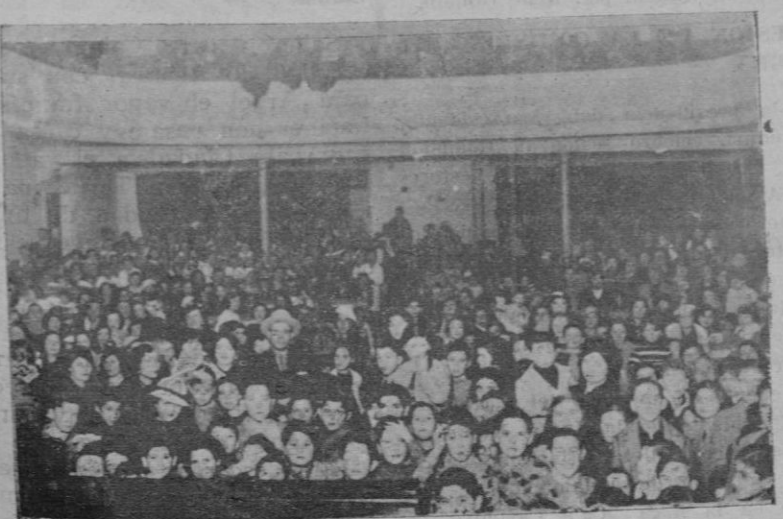
En el Salón Mallorca. — Aspecto que ofrecía el Salón Mallorca du- rante la celebración del festival infantil organizado por la emisio- Radio Mallorca.

LA FILADORA Formidable liquidación artículos de INVIERNO