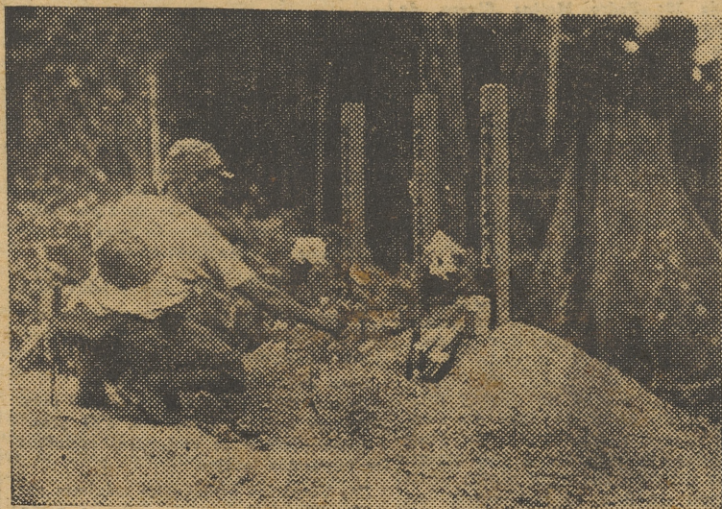
Un soldado japonés deposita flores en la tumba de un camarada caído en el frente.