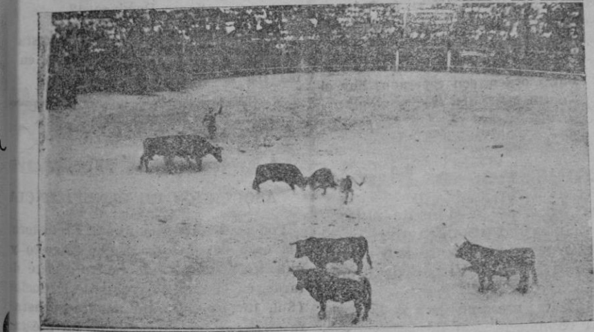
Los seis toros, hermosos ejemplares que han de lidiarse en la corrida del domingo por Lalanda, Carnicerito de Méjico y Corrochano, pocos momentos después de ser soltados en el redondel de la plaza