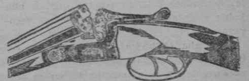
Muestra a menor precio que el de costo. Facultad devolver DUMENIEUX - EIBAR

Como lo angosto de las pinas callejas de Albarracín no permitían el paso de los camiones de sonido, hubo necesidad de emplear trescientos metros de cable para registrar el sonido.