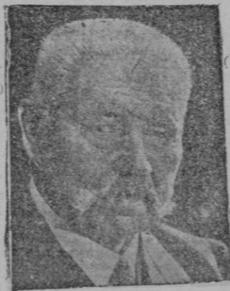
El mariscal Hindenburg, Presidente del Reich, que falleció ayer a los 87 años de edad

Es un "regalo" que se hace a aquel caserío, "regalo" del que nadie puede estar contento, a pesar de las seguridades de que será inofensivo. Alguien había de cargar con el difunto; a los que les ha tocado, hacer el difunto; a los que les ha tocado, hacer la nación.