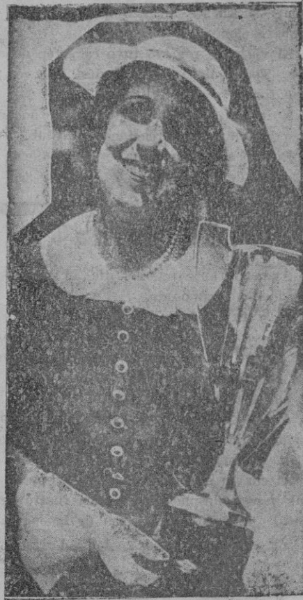
Lucrecia Bori, la famosa cantante española del teatro Metropolitano, de Nueva York, con la copa que le ha sido regalada por los alumnos de la Escuela Superior de Música, de Filadelfia