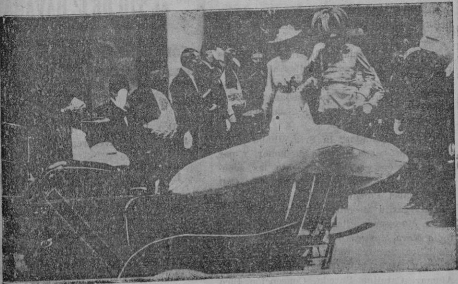
El archiduque Francisco Fernando, heredero de la corona de Austria, y su esposa, la duquesa de Hohenberg, al salir del Ayuntamiento de Sarajevo, momentos antes de producirse el atentado que les costó la vida, y que fué la causa inmediata de la gran guerra

En su editorial escribe «El Sob»: «De todos los oradores que intervinieron en el debate sobre la cuestión de la ley catalana de cultivos, solamente uno, el portavoz de la minoría socialista, el Sr. Prieto, llegó, en su conformidad con la actitud de la Generalidad, a abogar por el incumplimiento de la sentencia del Tribunal de Garantías. Tal vez ofrezca dudas la posición del señor Azafia, porque en este asunto concreto no fué muy claro. Tanto él como el señor Maura explicaron lo que el Gobierno debió hacer antes de utilizar los recursos que le conceden la Constitución y la ley del Tribunal de Garantías. El señor Azafia, contestaba así al señor Cambó: «Yo no hubiese permitido que la ley se hubiera llegado a votar; me hubiera interpuesto antes de votarse la ley.» Por su parte, el Sr. Maura, de ingenio más fértil, habría intentado el desestímulo de Cataluña antes de la votación, en la votación y después de la votación mediante negociaciones entre los dos Gobiernos».