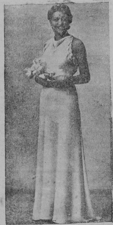
"Miss Aragón", que ha sido premiada por el tipo más perfecto

mas—aparte el concepto Patria, que olvidó en su enumeración—nada menos que el Orden, la Familia, la Religión y la Propiedad? Pero el señor Maura y los que como él piensen, ¿tienen preparado en todo el área nacional el mecanismo de gobierno útil, inmediato, incruento, para que, derribado el actual, tenga España siquiera la esperanza de que aquellos principios, comunes al señor Maura y a nosotros, habrán de ser relativamente respetados, como hoy lo van siendo, gracias—no lo negará el señor Maura—a esa fuerza de derechas que con esa táctica tan vituperada por él desvió de la gobernación española aquella corriente sectaria y destructora contra la cual no supieron o no pudieron poner diques los monárquicos del 14 de Abril? Pero sin esa táctica—que no es táctica en su mezquina aceptación de habilidad combativa, sino programa lealmente declarado en todo instante—, sin esa táctica, repetimos, ¿estarían a estas horas en sus hogares tantos y tantos españoles como hoy respiran el aire de la libertad? Sin la reacción producida en España por Gil Robles y las fuerzas derechistas que él logró despertar a la lucha en aquellas horas de letargo o de huida para tantos como hoy no descansan lenguas poniendo cátedras de patriotismo y de valor ciudadano, ¿hubiera sido posible el presente que hoy vivimos, malo, muy malo todavía; pero mejor, infinitamente mejor que el ayer, demasiado re-