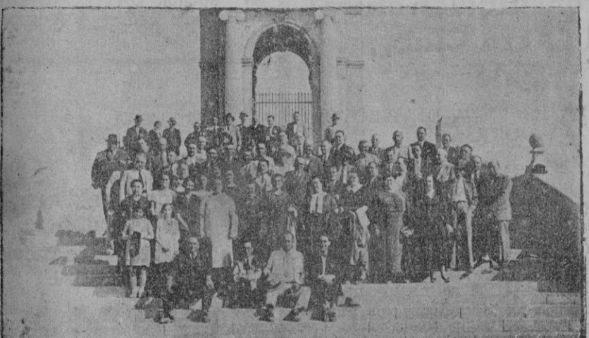
Grupo de excursionistas del Partido Regionalista de Palma en San Salvador de Felanitx.

distinguió siempre por su republicanismo; las informaciones han dicho, incluso a los más obsecados, como hay algo en el fondo de todos los pechos honrados que no puede abogarse por muy tumultuosa que sea la legislación. Y es que el misterio del más allá, pavoroso para unos, tenebroso para otros y luminoso y reconfortante para el creyente, está siempre latente, en una u otra forma, en todos los pechos, y necesita precisamente de una expansión que se concreta y, como si dijéramos, toma forma plástica en la devoción a esas imágenes. El Santo Cristo de los Alfareros cuenta con una devoción larga de años y de generaciones. No hemos ahora de tejer un panegírico, conocido de todos los mallorquines y singularmente de los ciudadanos vecinos del barrio del Socorro. Otro: la procesión debía recorrer un reducidísimo itinerario: dar tan solo la vuelta a la breve plazuela del Socorro, y estaba autorizada por la Autoridad. ¿Por qué lanzarse airadamente contra unos pacíficos vecinos, muchos de ellos chiquillos, y unos pocos religiosos que cuidan de la sagrada lámpara de la espiritualidad? ¿No se celebró en la misma plaza del Socorro un mitin socialista y nadie que se pamos fué a perturbarlo? Y va diferencia del desfile de una modesta procesión, sin ataques contra nadie, a un mitin político. La calle ha de ser para todos, pero sin molestias para los demás, que es la forma de armónica convivencia.