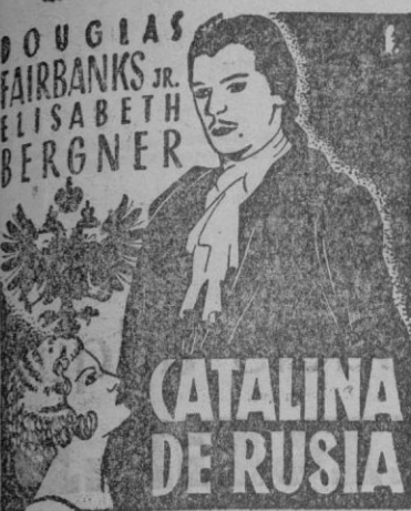
CATALINA DE RUSIA

Un gran film donde se recojen todas las gamas exquisitas del arte.