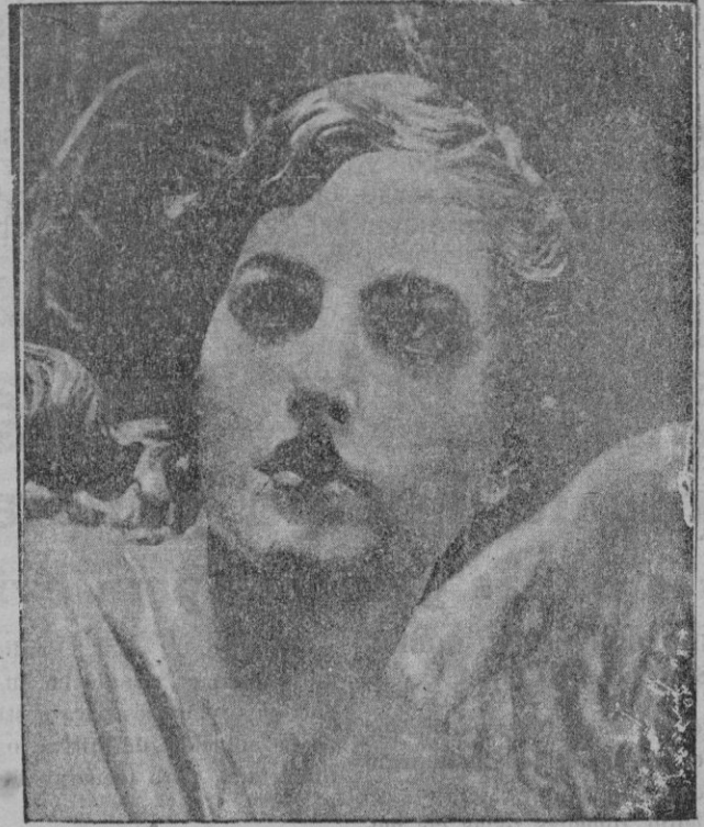
Las procesiones de Semana Santa en Murcia.—El Angel de la oración en el Huerto, famosa escultura del gran Salzillo

Yo no sé—añade el señor Lerroix—lo que estará en el Poder. Poco o mucho, es igual. Pero quiero señalar que esto no es un plan