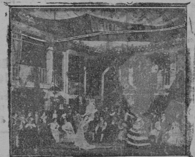
Una de las escenas de «Doña Francisquita» como se ha presentado en Montecarlo, donde se ha estrenado con brillante resultado

I veigüe la nit i amb el seu mantell fosc estliviava, a l'exercit cristià la vista de tan-