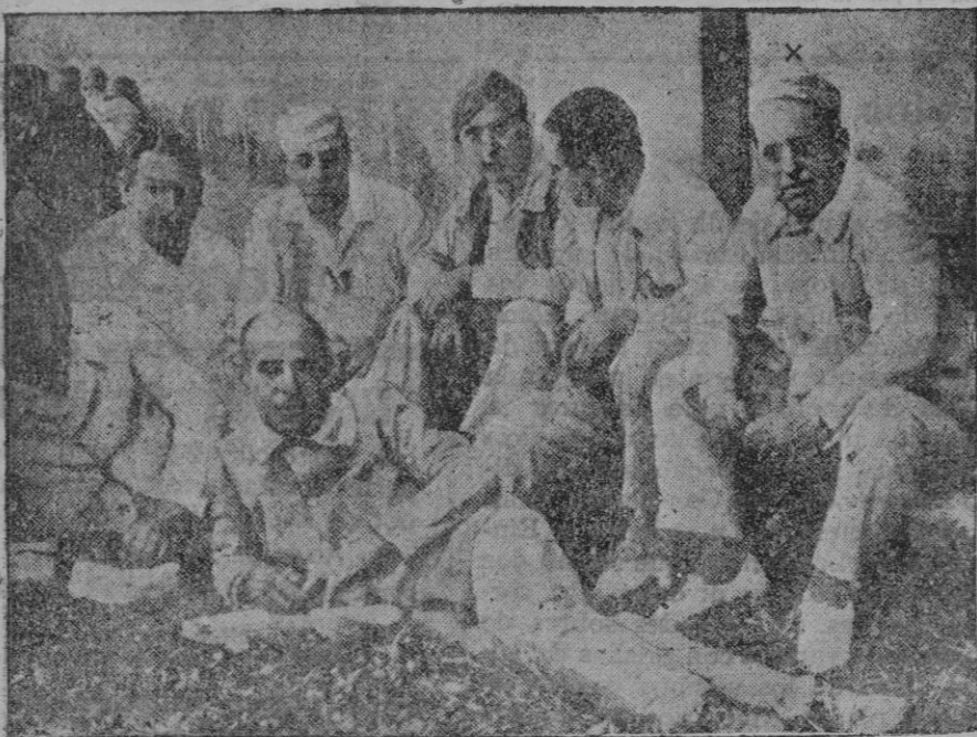
El general Sanjurjo en el penal del Dueso, el último día que pasó en él