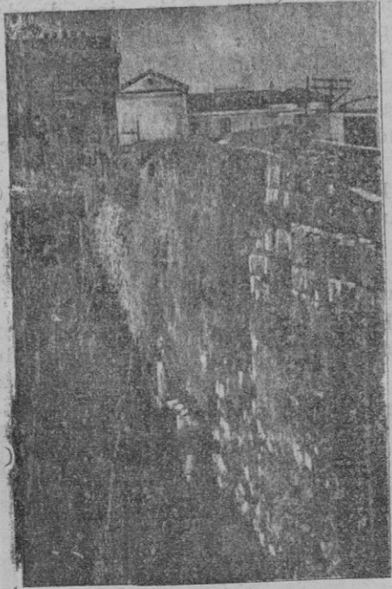
Un aspecto del paseo arqueológico que acaba de inaugurarse en Tarragona. Allí han conservado los restos de sus murallas y de sus monumentos que hablan de su historia, y aquí no quisieron conservar ni la puerta de Santa Margarita

Se pone en conocimiento de los industriales agremiados que en la Administración de Rentas Públicas de esta provincia están de manifiesto durante quince días laborables y horas de once a una los repartos provisionales para que puedan examinarlos y formular contra ellos las reclamaciones que estimen procedentes en las oportunas Juntas de Agravios que se señalarán oportunamente, conforme previene la base 39 de las aprobadas por R. D. de 11 de mayo de 1926. Palma 19 de Octubre de 1933.