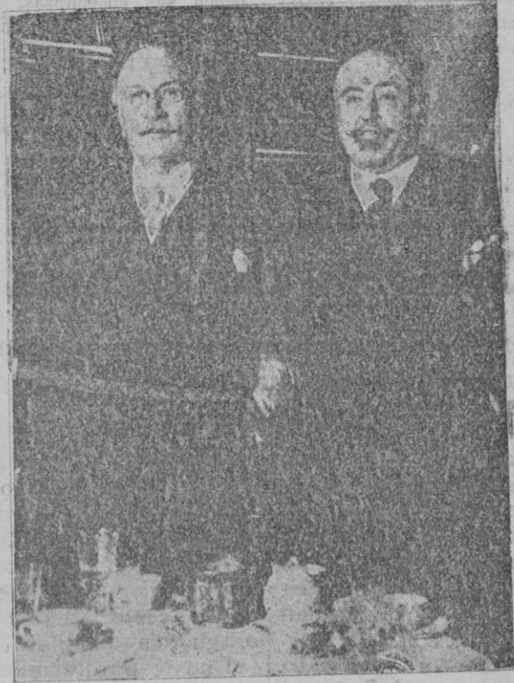
Con motivo del ingreso de Sr. Alba en el partido radical, dicho político ha obsequiado con un banquete al señor Lerroux y a sus ministros.—Fotografía obtenida a los postres, de los señores Lerroux y Alba