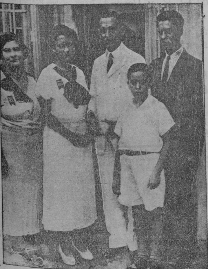
El nuevo presidente de la República de Cuba, doctor don Ramón Grau San Martín, retratado con sus sobrinos