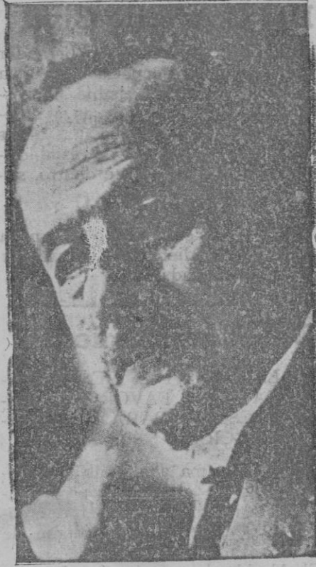
El profesor Paul Vincent, que ha descubierto el suero contra la apendicitis

Gracias a esta cooperación económica y personal ha sido posible sostener las Escuelas ya fundadas (muchas de las cuales se hubieran cerrado por faltarles las subvenciones oficiales con que se les ayudaba, o los donativos de bienhechores, cuyos intereses han padecido grandes quebrantos) y crearse otras nuevas, mejorar los locales y el material de enseñanza y multiplicar las cateque-