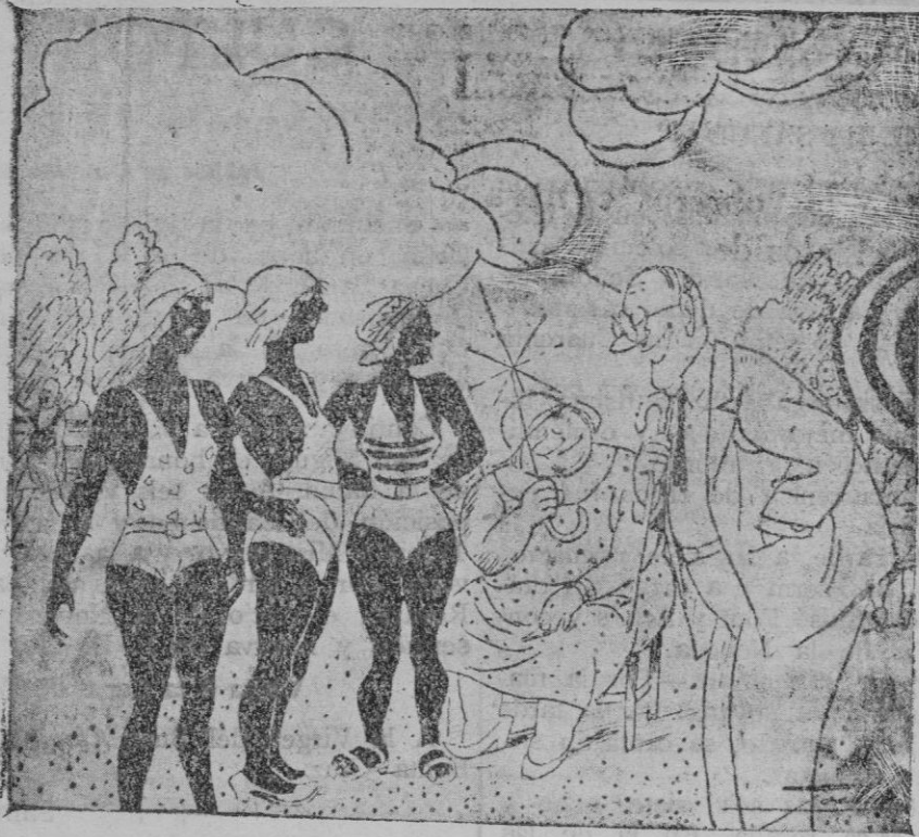
Un padre que baja a la playa donde sus hijas hacen baños de sol. —En casa os reconozco por el vestido; pero aquí no hay manera. ¿Cuál de vosotras es Paquita?