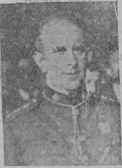
El general irlandés O'Duffy, jefe de las "Camisas azules", cuya organización militarista quiere suprimir De Valera

esa consulta representa ya la admisión de un sector contrario a sus decisiones, de importancia grande, cuando a él se supedita el desarrollo de los medios para la enseñanza laica. Se podrá colegir el éxito y el fundamento de la prohibición de la enseñanza a las congregaciones religiosas, por el número de los que opten por seguir recibiendo una enseñanza distinta a la laica que les ofrece gratuitamente el Estado.