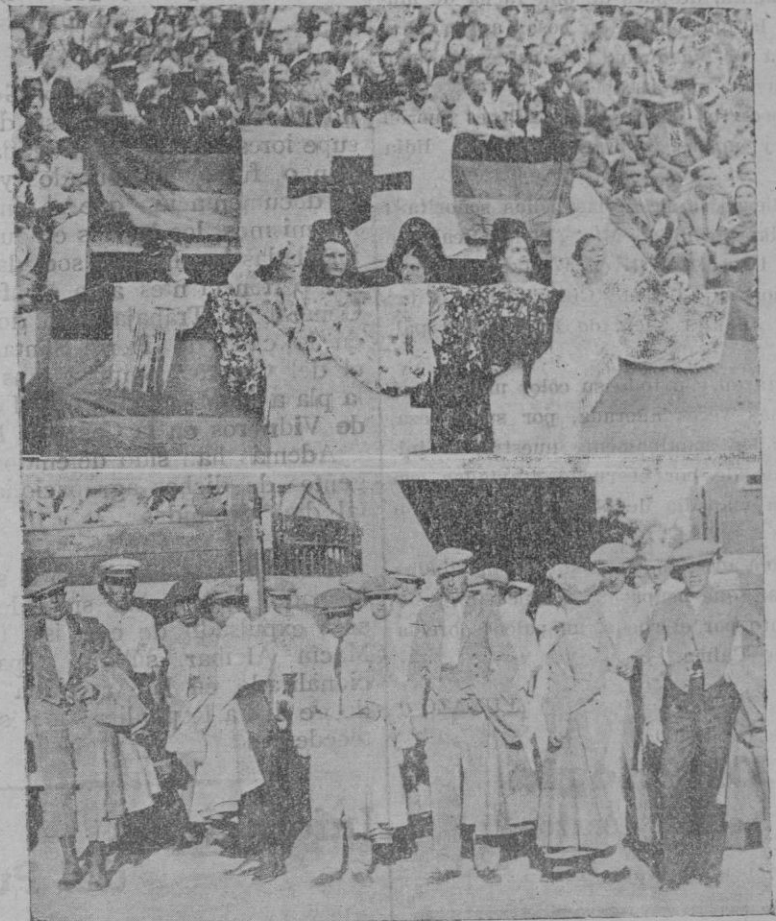
El palco de las presidentas.—Las cuadrillas antes del desfile