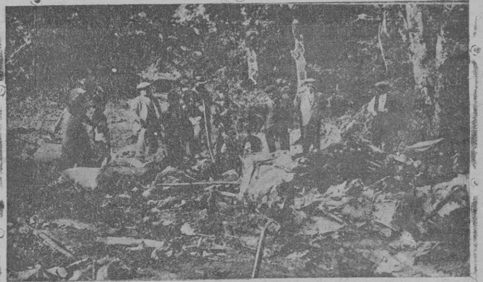
Estado en que quedó el avión procedente de Casablanca, que se incendió al volar sobre Cataluña, pereciendo los tres tripulantes y los tres pasajeros que llevaba

tantes en la villa de La Puebla; las que sustrajo en ocasión de hallarlas abandonadas, de las cuales cinco las vendió a distintos vecinos de Llubí, 65, 70, 100, 90 y 85 pesetas respectivamente, las que han sido recuperadas, como igualmente la ocupada en Llubí y otra que tenía escondida en su domicilio.