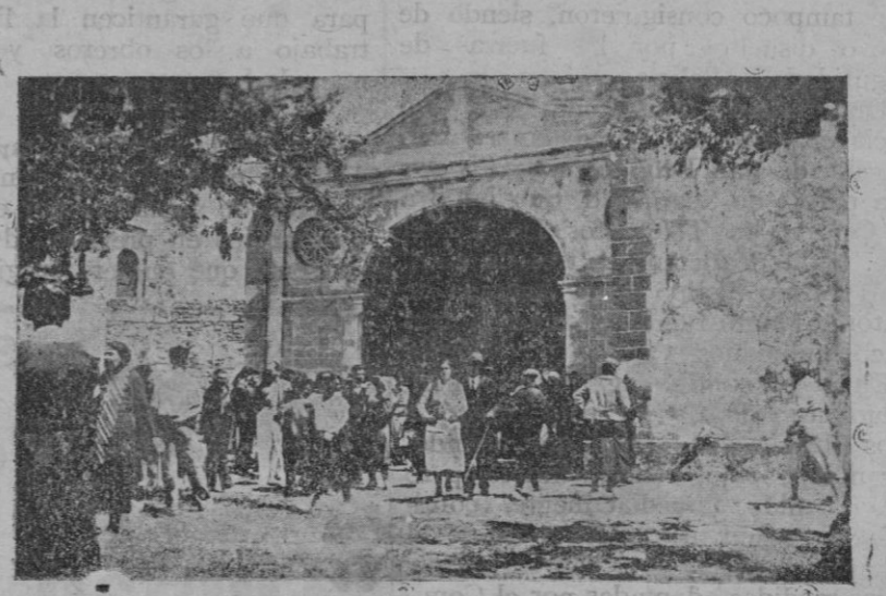
Excursionistas de la Juventud Serrífica de S. Francisco en el Puig de Pó Hensu