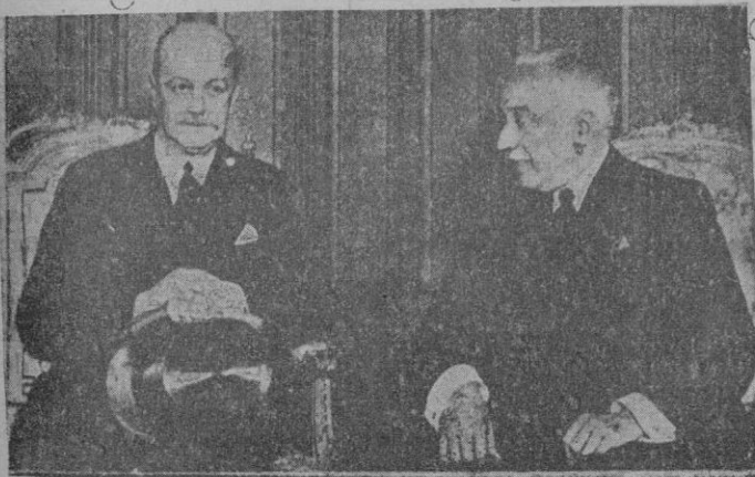
El vicepresidente de la Argentina Sr. Roca, con el Presidente de la República señor Alcalá Zamora