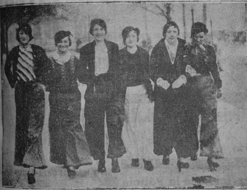
La moda del pantalón femenino que no solo es patrimonio de las artistas de cine. Ha conquistado a unas inglesas devotas de la moda masculina. En Palma también han desfilado extranjeras ataviadas con pantalón hombruno