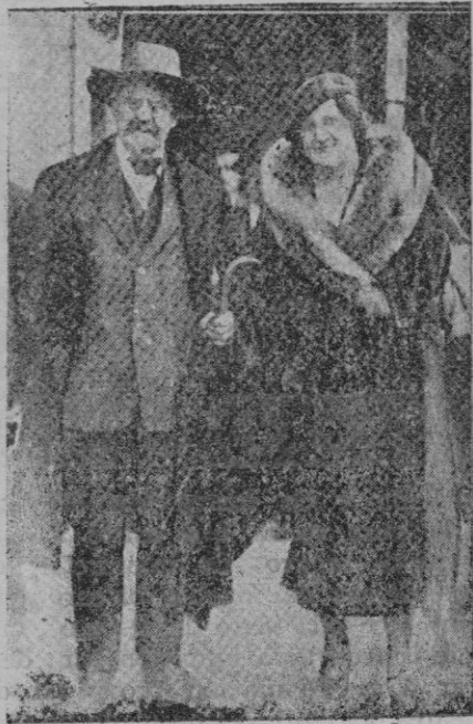
El jefe de los socialistas belgas M. Emile G. Vandervelde, acompañado de su esposa, a su llegada a Madrid

¿Descuido? ¿Traspapelada? Conviene por lo tanto insistir. Los argumentos son de fuerza; pagamos lo mismo que los abonados de Barcelona. Allí puede comunicarse con 41.000 teléfonos; aquí con 1200. Allí pueden conferenciar con el resto de España por cantidades aborables; aquí "disfrutamos" de unas tarifas prohibitivas.