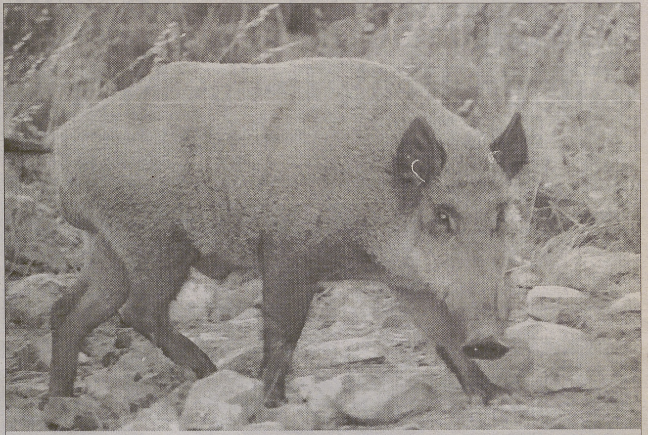
Siguen dando juego las jabalíes en los montes de La Mancha.