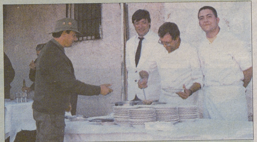
Los del Coto de Santa Cruz de Mudela, sirvieron el buen guiso en este coto.