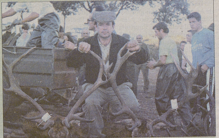
A algunos, la fortuna les asistió y consiguieron su collera de esta categoría.