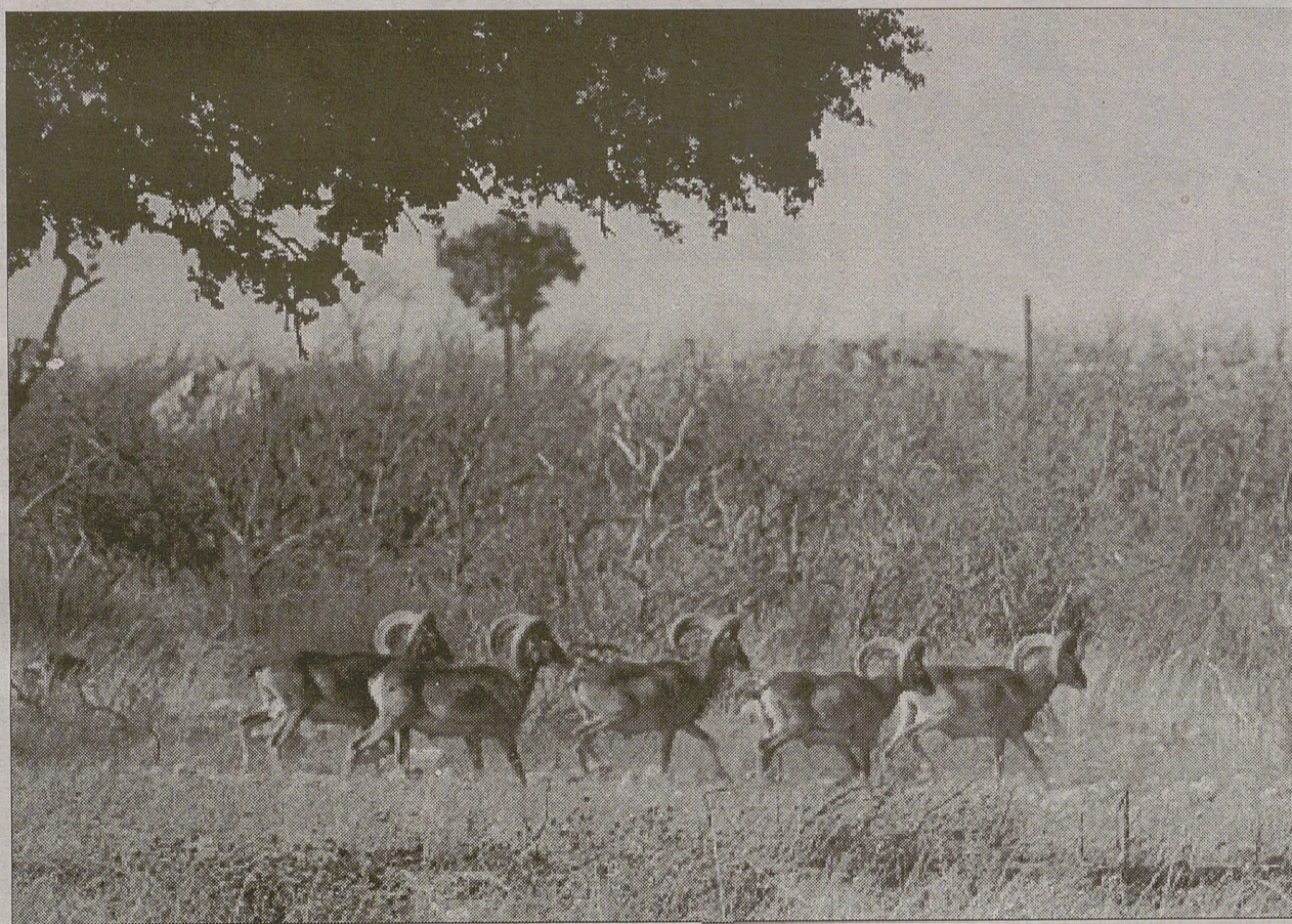
En el sur de la nuestra región, en la provincia de Ciudad Real, las especies cinegéticas están dando buenos trofeos.

Se cobraron doce venados, seis gamos y catorce muflones. La media del venado fue muy buena con un venado de plata y cuatro de bronce, de los gamos un plata y tres bronce. De los muflones dos de bronce y el resto buenos.