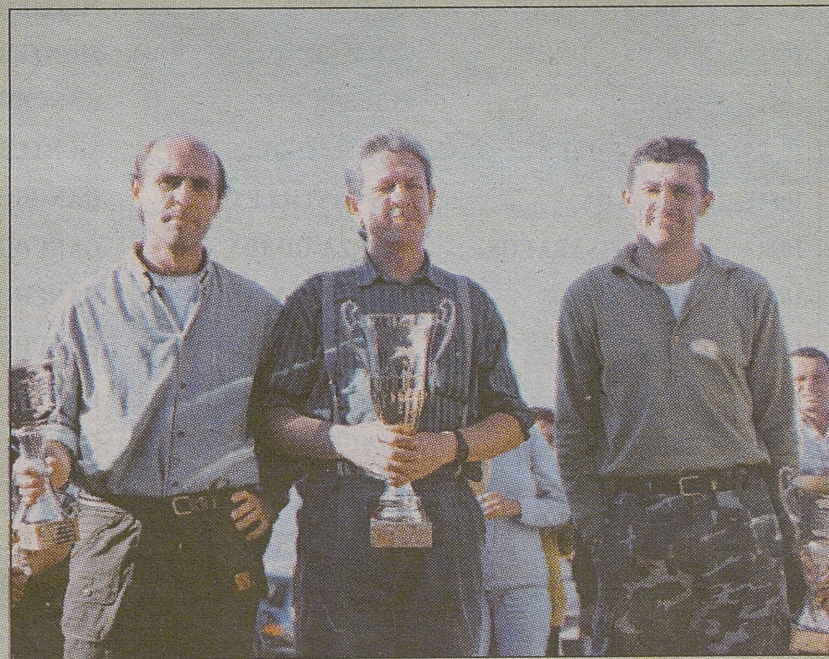
Los tres primeros clasificados, en el regional de caza menor con perro.