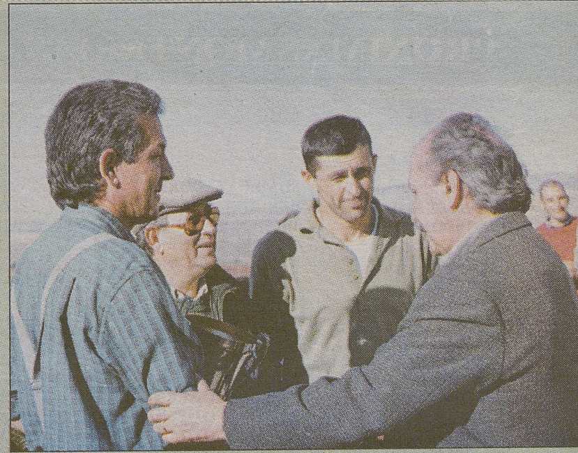
Felicitación a los dos ciudadrealenses y al delegado provincial de C-Real.