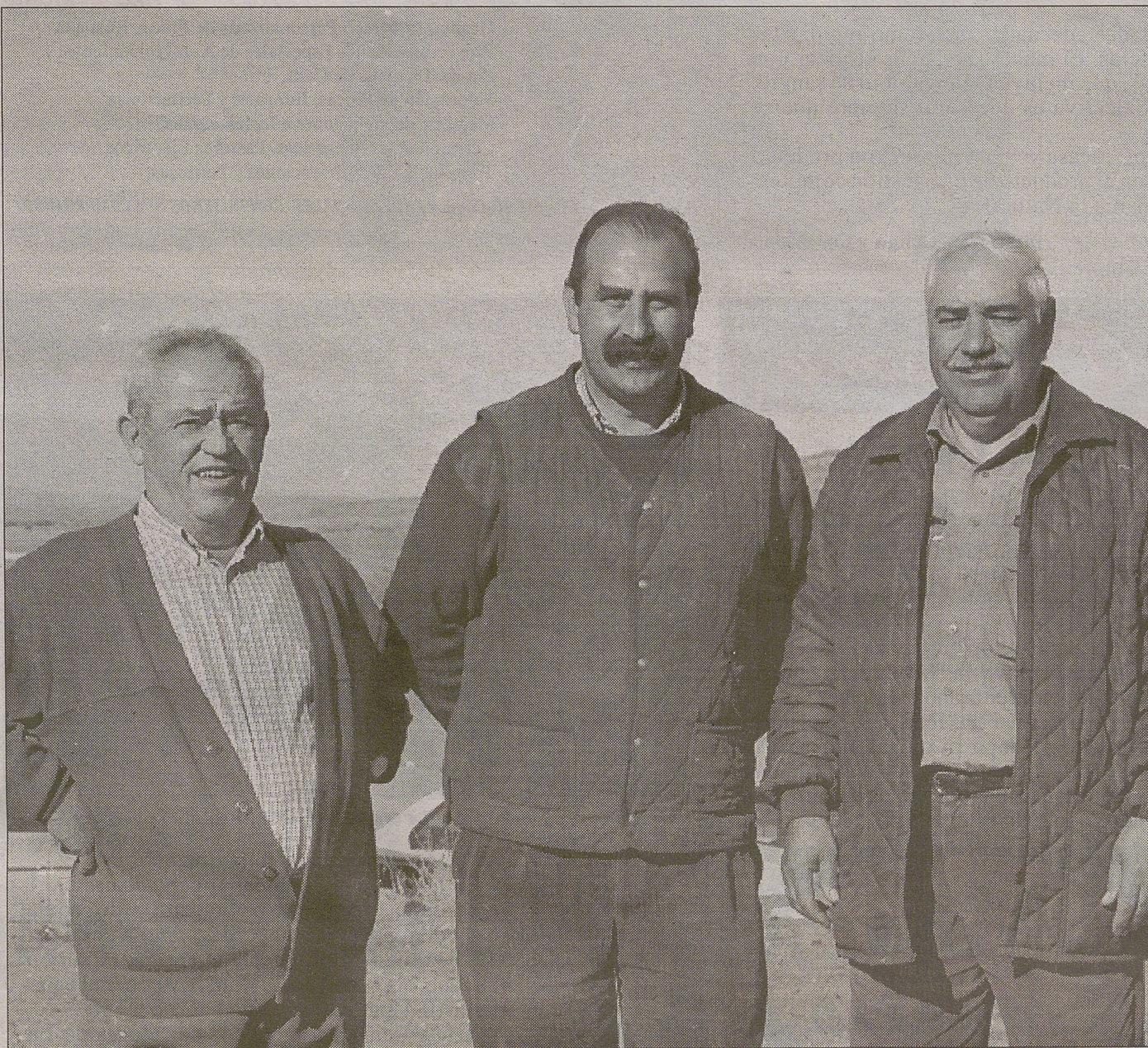
Los dos campeones de la categoría Veteranos, clasificados en 2º y 3º lugar, junto al delegado provincial de la Federación de Caza.