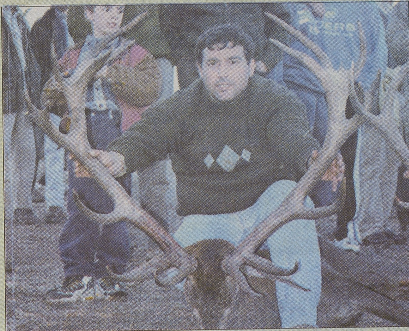
Hombres que nunca creyeron alcanzar un buen trofeo en estos parajes, (Oro).

zo de estos hombres en favor de las sagradas leyes de montería, las que deben seguir latentes, por siglos y siglos.