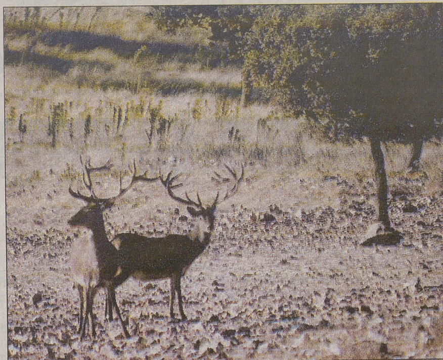
La Caza Mayor constituye una alternativa, en terrenos marginales.