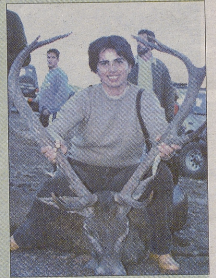
Estos, y en el centro a la izquierda buenos trofeos de Valdeladrones.