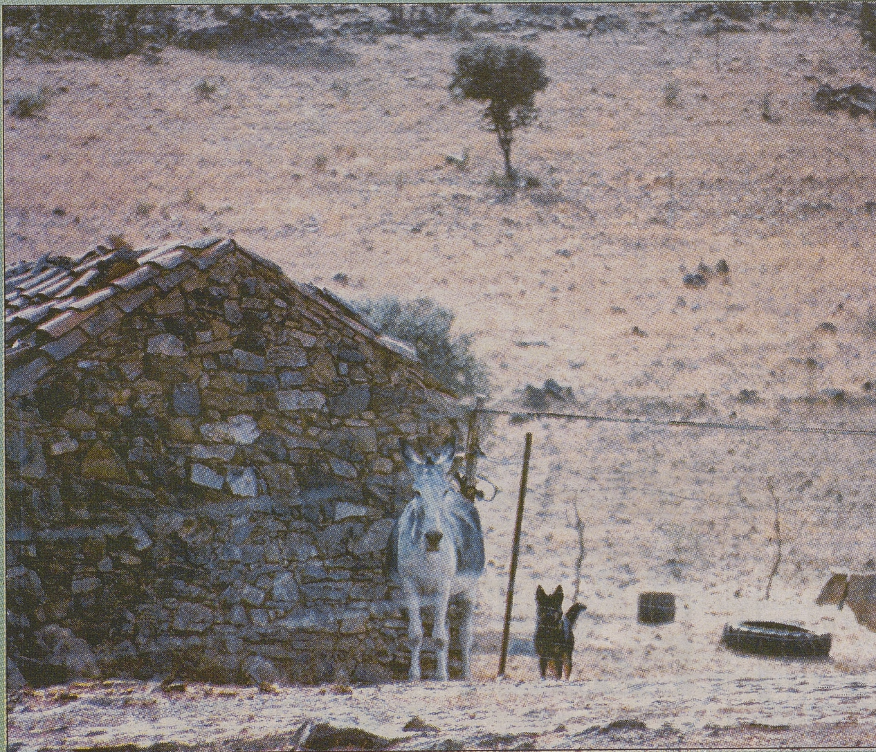
En un cortijo de Sierra Madrona, al sur de Castilla...una trocha ciega...donde el monte domina los barrancos. R.TERRIZA

Rica es La Mancha en su gastronomía popular, por la sencillez y por su buen gusto, pero por las buenas condiciones que hoy tenemos para degustar estas succulentas carnes y a tan buenos precios del mercado, yo invito a seguir todos los jueves, nuestra cocina, la que ofrecemos para seguir manteniendo vivas las raíces de nuestros antepasados de los sencillos pueblos de La Mancha, y saboreando platos, algunos perdidos y de un gran valor nutritivo, los que un día fueran tan codiciados en la corte de los reyes de Castilla.