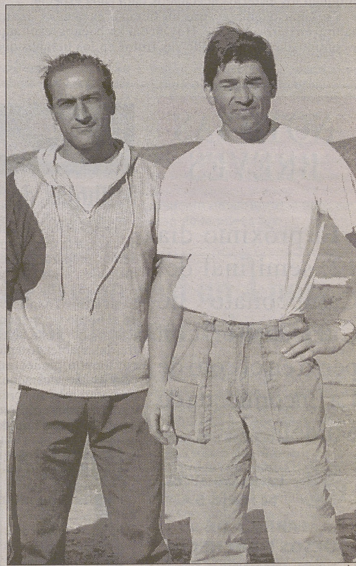
Los otros dos componentes del grupo Senior no clasificados.