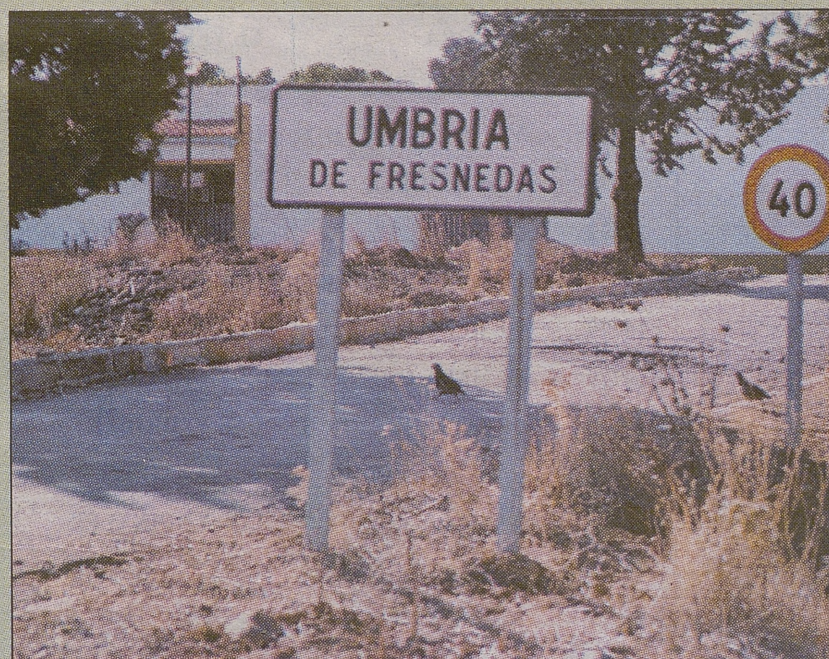
Entre Umbría de Fresnedas y Los Mirones, se celebró el autonómico.