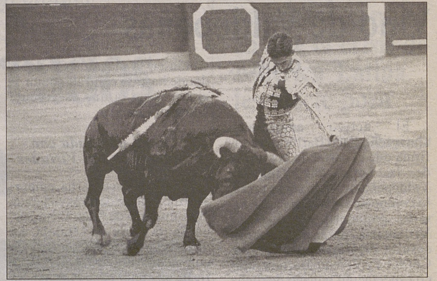
Los naturales de Reina Rincón, de lo mejor de la Feria.