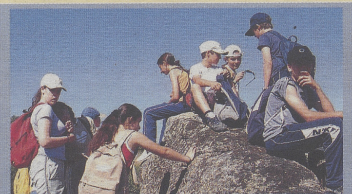
Desde Hoyo de Pinares nos envían esta fotografía de una excursión otoñal de alumnos del CEO Virgen de Navaserrada, cuyo objetivo fue el conocimiento del entorno en que se asienta esta bella localidad. M. Tabasco

defensa de nuestro medio ambiente más cercano» y esta vez han despertado el interés de sus coordinadores historias elaboradas por sus alumnos inmigrantes sobre los distintos juegos infantiles del mundo; relatos, poemas; excursiones; colaboraciones de antiguos alumnos... ¡Enhorabuena!