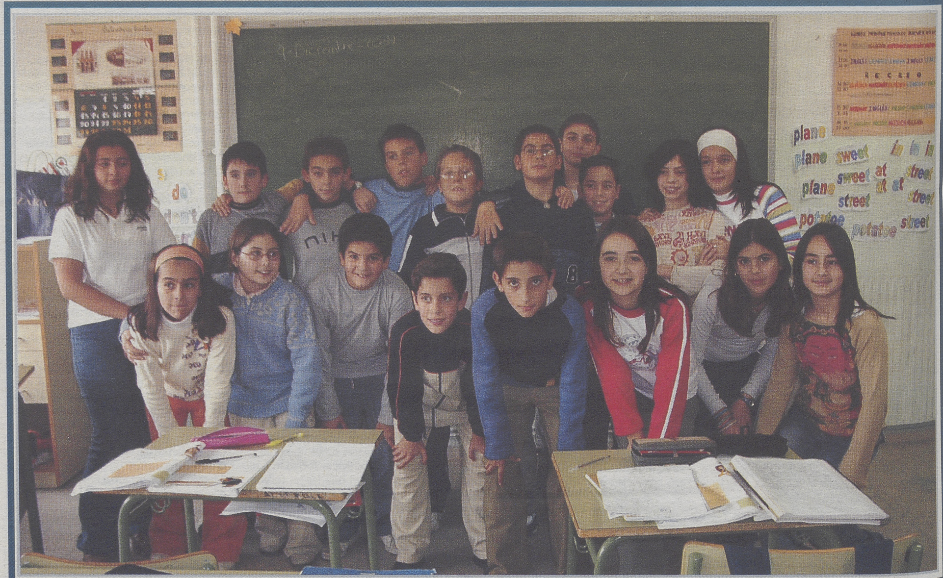
Sexto 1 del colegio público Arevacos. (Arévalo)