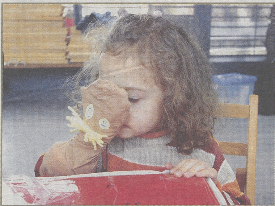
Una niña, en un taller de manualidades en el mirador de los Cuatro Postes.