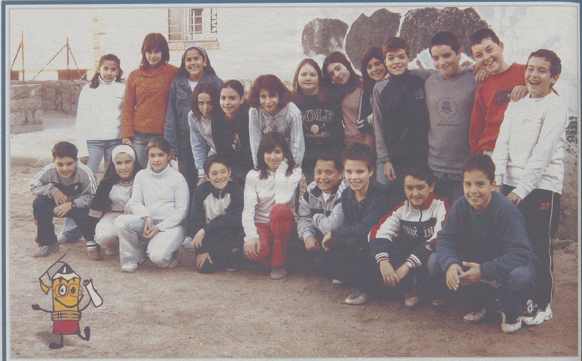
Sexto del centro de enseñanza secundaria Virgen de Navaserrada. (Hoyo de Pinares)

'A tiza!' homenajea a los alumnos que se despiden de la Primaria durante este curso