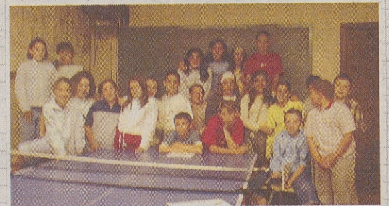
► C. P. ZORRILLA MONROY / ARENAS

Nuestro Centro Educativo tiene dos secciones; y una de ellas, la del Cerro de San Agustín, se levanta en lo que fue un Monasterio de Padres Agustinos. Nos han contado los mayores que este Monasterio era muy importante, porque desde este lugar privilegiado de Arenas de San Pedro fue desde donde Fray Luis de León escribió parte de su universal obra, posiblemente emocionado y cegado por la belleza y majestuosidad de la visión de la Sierra de Gredos, uno de los grandes atractivos medio ambientales de la capital del Valle del Tiétar.