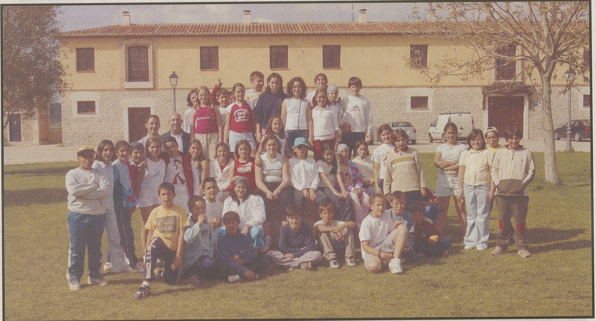
Alumnos del colegio público Zorrilla Monroy de Arenas de San Pedro.