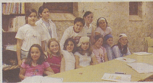
► C. P. ZORRILLA MONROY / ARENAS

Arenas de San Pedro no siempre ha estado donde está actualmente, hace muchos años el pueblo comenzó a crecer alrededor de una ermita situada en la margen derecha del puente que cruza el río Arenal, en el paraje conocido como «Los llanos». Una madre tenía por costumbre dejar a su hijo dormido cerca de la ermita de los llanos y mientras el niño dormía ella aprovechaba para lavar la ropa en el charco que había al lado; un desgraciado día cuando la madre regresó a recoger a su hijo encontró que las hormigas lo habían devorado. No se pudo hacer nada por el niño pero la comunidad decidió trasladar el pueblo a su actual ubicación.