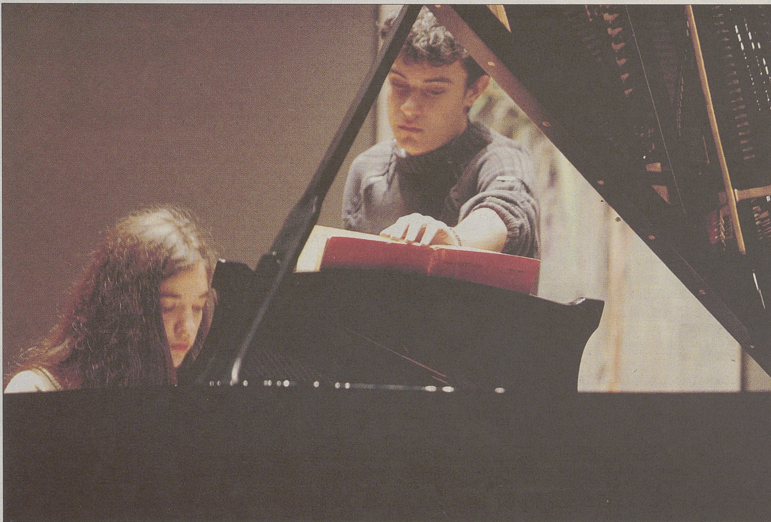
Una de las dos alumnas que participaron en el recital de piano interpretado el pasado fin de semana dentro del programa 'Domingos de Música Joven'.