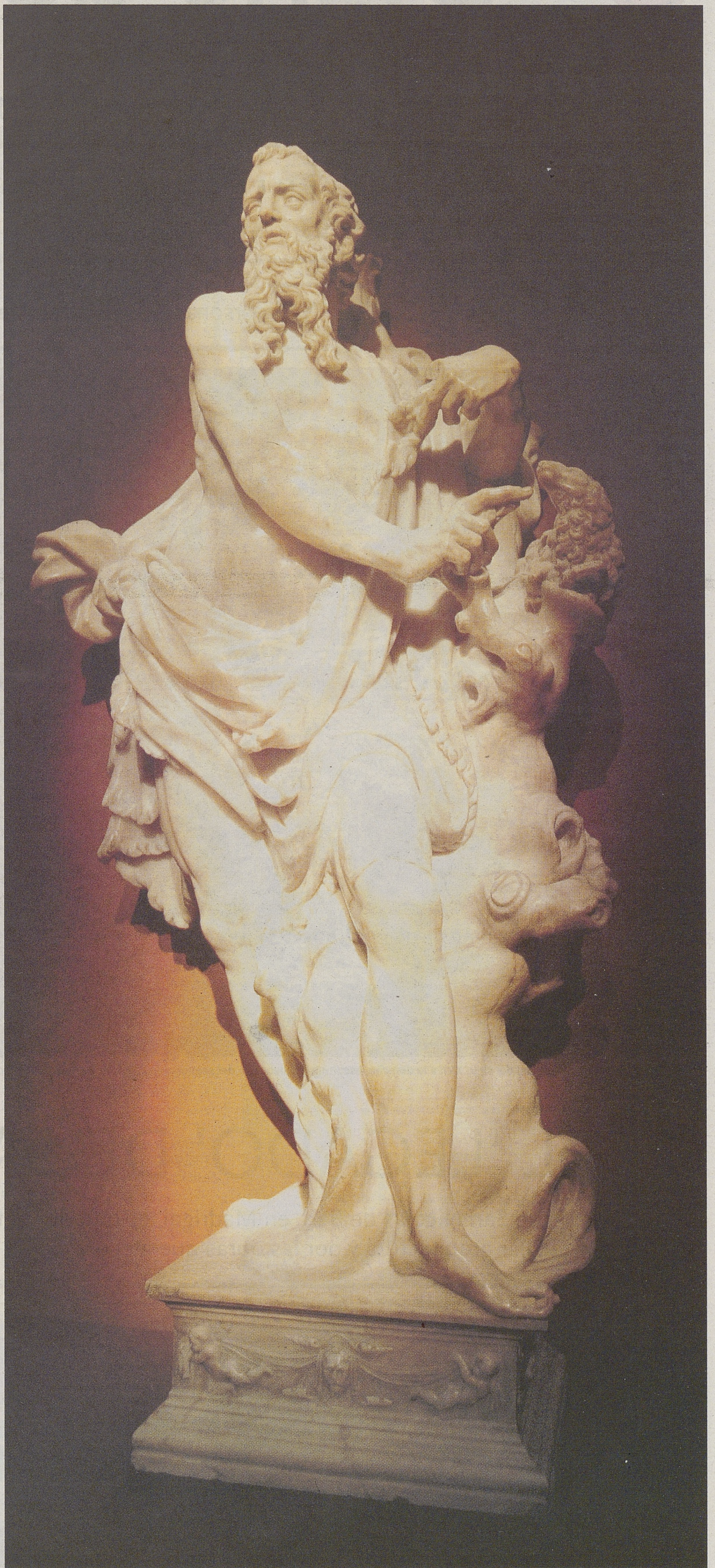
San Juan Bautista, procedente del retablo de alabastro del sepulcro del comendador Gonzalo Guiral.

De aspecto románico-mudéjar, el Renacimiento acertó a embellecer este templo, con dos capillas añadidas del siglo XVI, al igual que los dos bellos sepulcros de alabastro y probablemente el coro. Objetos de esa misma época son numerosos.