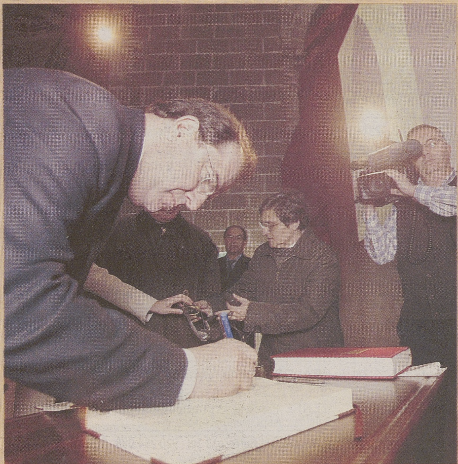
Importante espaldarazo. La exposición 'Testigos', por la que ya han pasado más de 20.000 personas, recibió ayer un gran espaldarazo con la visita que realizaron todos los miembros del Ejecutivo regional. El presidente de la Junta, Juan Vicente Herrera, que ya pudo contemplar la muestra el día de su inauguración, donde acompañó a los Duques de Lugo, pudo admirar de nuevo la presente edición de Las Edades del Hombre y en esta oportunidad estampó su firma en el libro de honor de la exposición, al igual que el resto de los componentes del Ejecutivo regional.