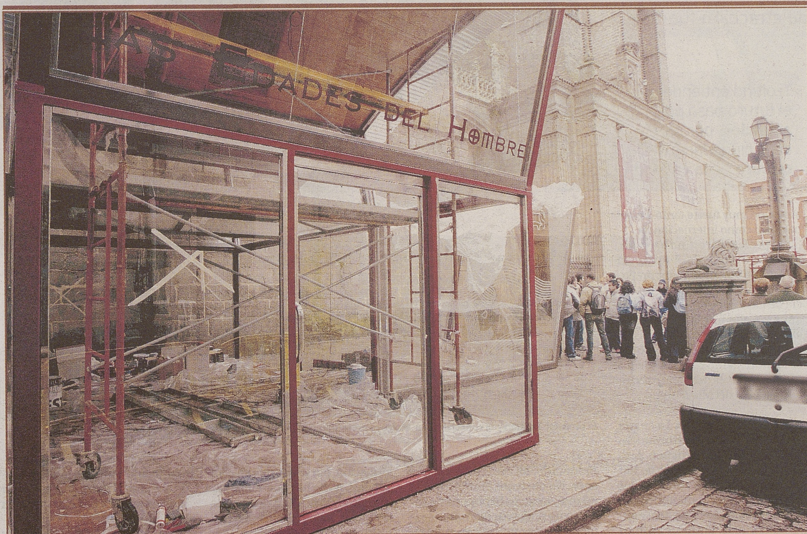
Aspecto de la caseta que se instala en la Plaza de la Catedral.

visitaron Las Edades del Hombre en su I semana