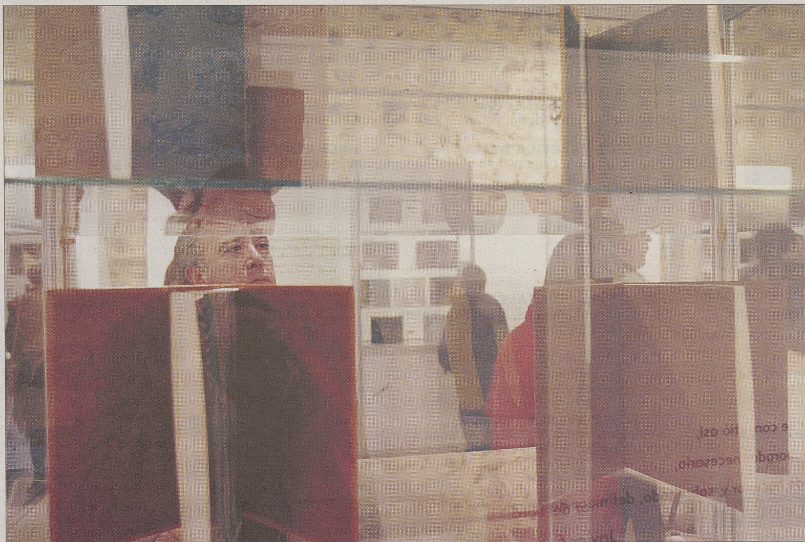
La exposición fue inaugurada oficialmente el pasado 13 de abril.