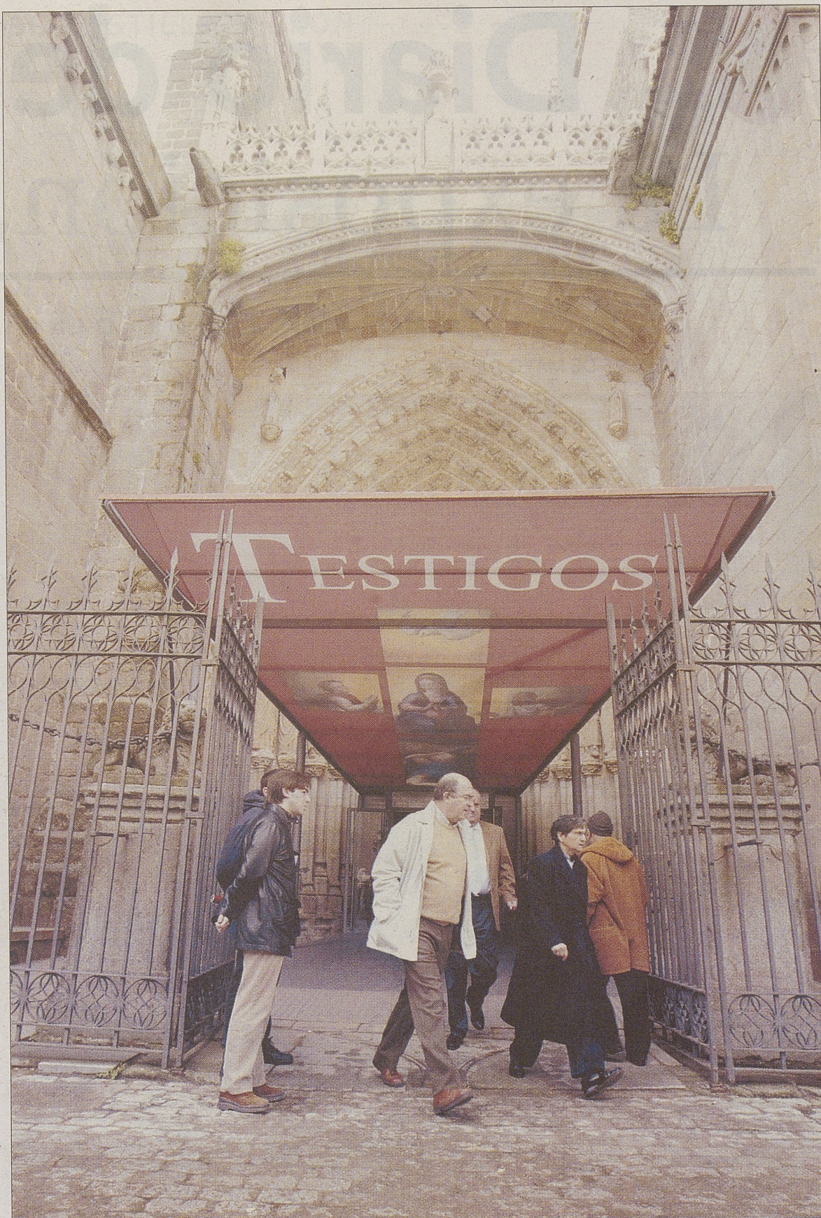
El simulacro permitirá poner en práctica el Plan Municipal de Emergencias preparado para Las Edades.