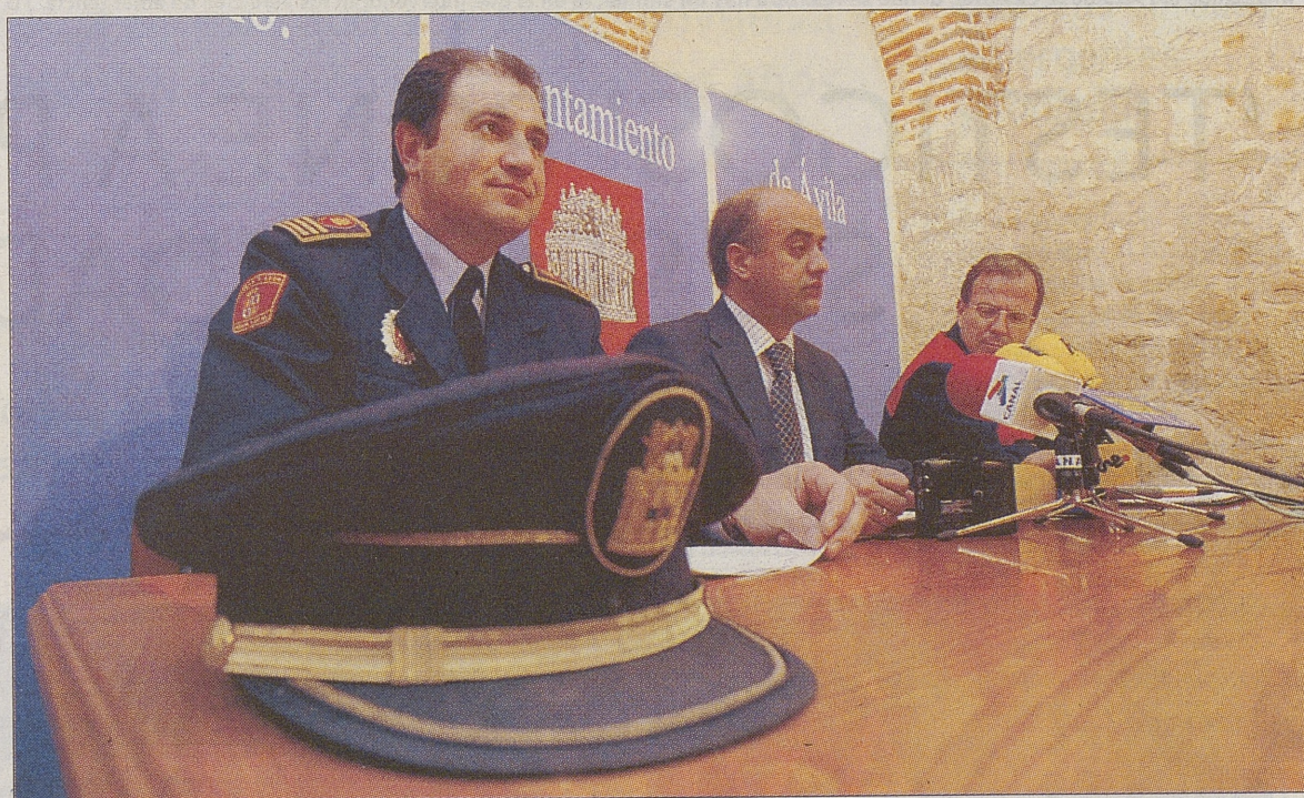
El alcalde de Ávila, acompañado por los jefes de la Policía Local y del Cuerpo de Bomberos, presentó esta iniciativa.

Señora de Sonsoles deberá poner en marcha su plan de catástrofes externas para atender a los supuestos heridos».