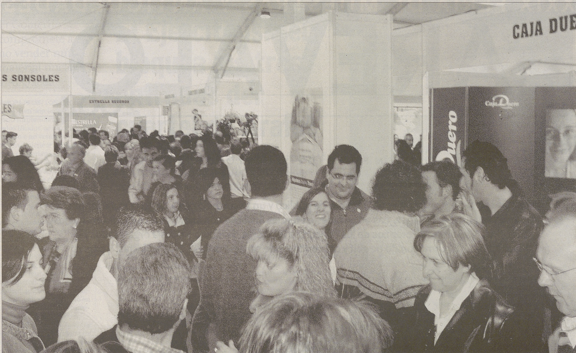
Imagen del público en la carpa de la Feria de Muestras, en la tarde del domingo.