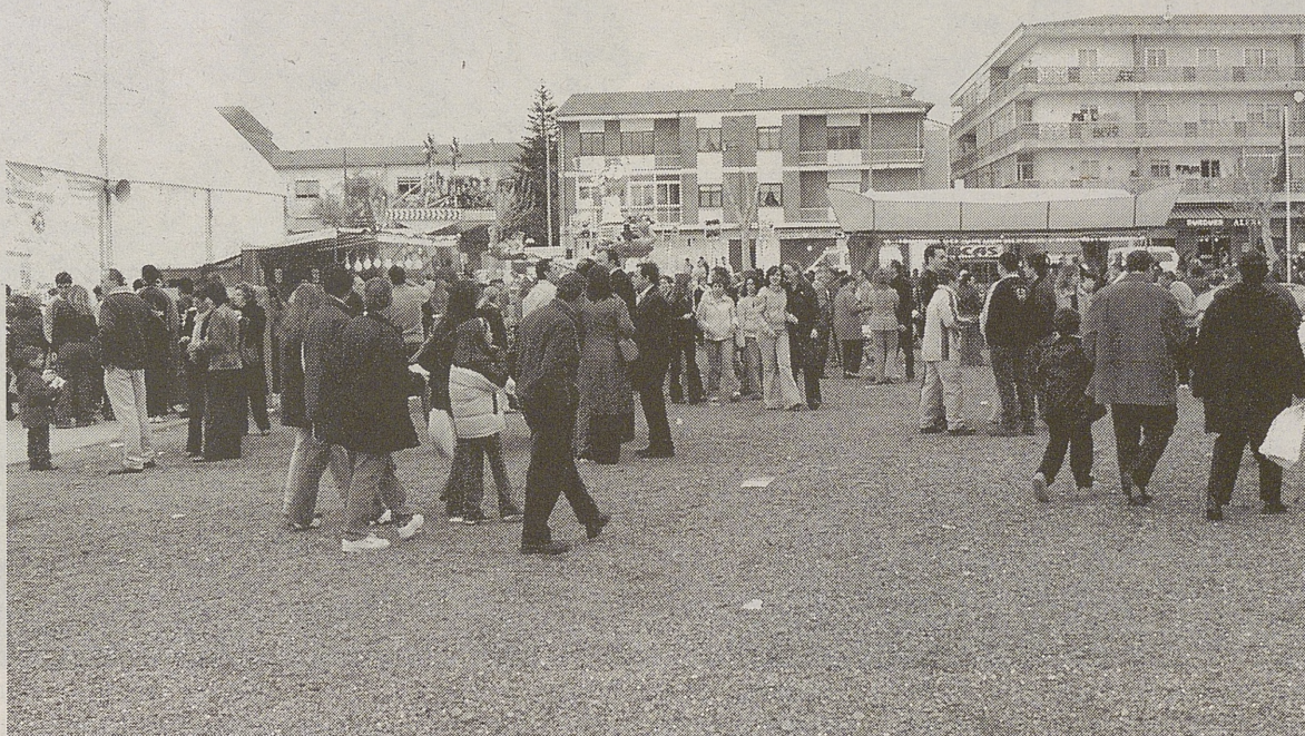
Visitantes en el recinto ferial del Parque Vellando.

Al éxito de público se ha unido el éxito de ventas por parte de los expositores de la carpa de la Feria de Muestras, especialmente aquellos de artículos de regalo como flores, perfumes o textil que aprovecharon el tirón comercial del Día de la Madre. Los expositores de la carpa han valorado positivamente el cambio de lugar de exposición que ha permitido crear un recinto más amplio que el Frontón Municipal, con pasillos más ancho, que han facilitado la circulación del público en los momentos de mayor afluencia. El Ayuntamiento de Arévalo ha realizado además una