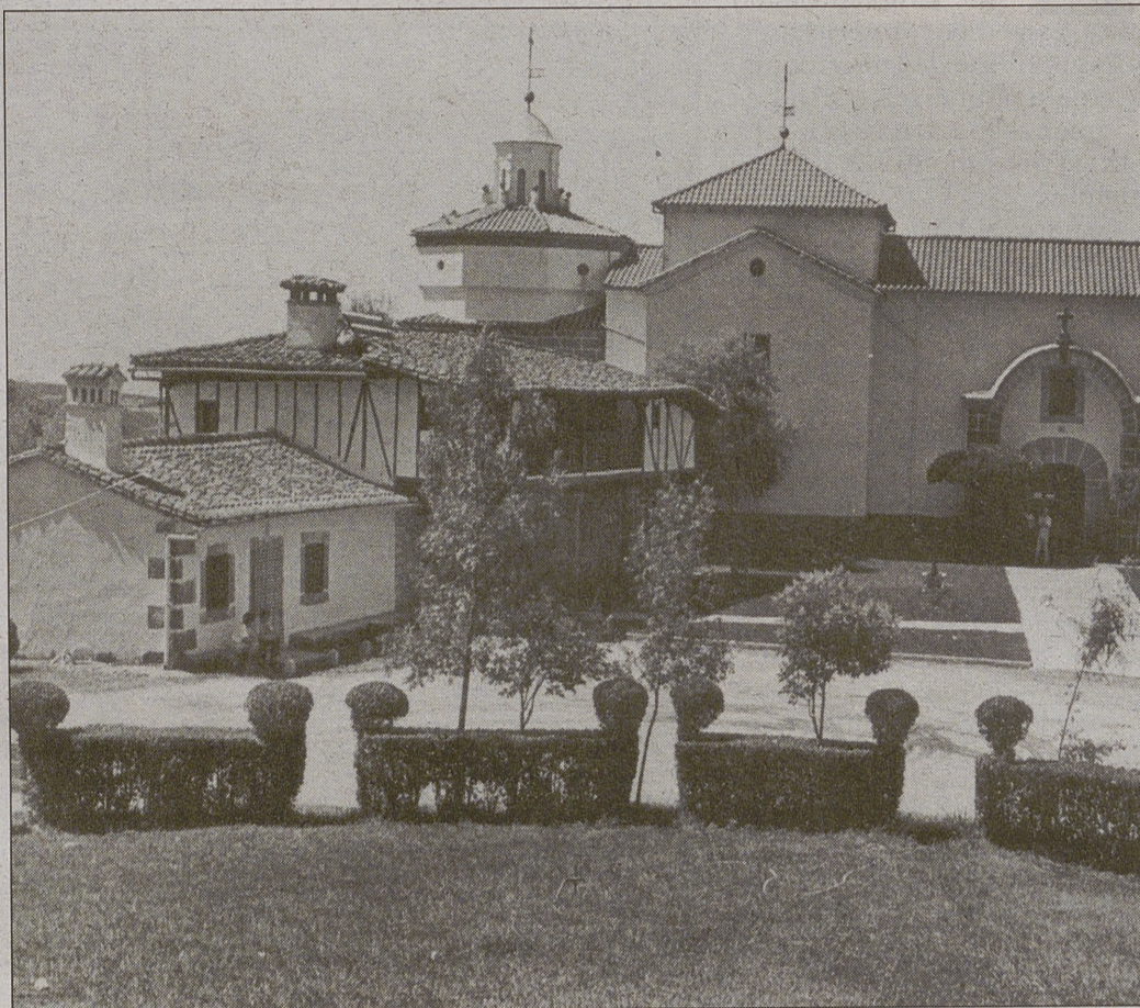
Santuario de Nuestra Señora de Chilla.

Si nos pasamos al capítulo de gastos lo que más me ha llamado la atención ha sido el comprobar que todos lo que anda-