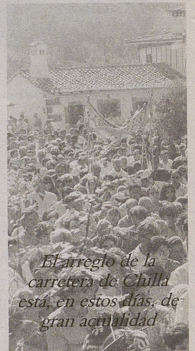
El arreglo de la carretera de Chilla está, en estos días, de gran actualidad

Y colorín, colorado... se acabó el cuento.