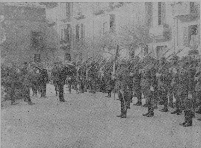
NUESTRAS PRIMERAS AUTORIDADES SALUDANDO A LA BANDERA