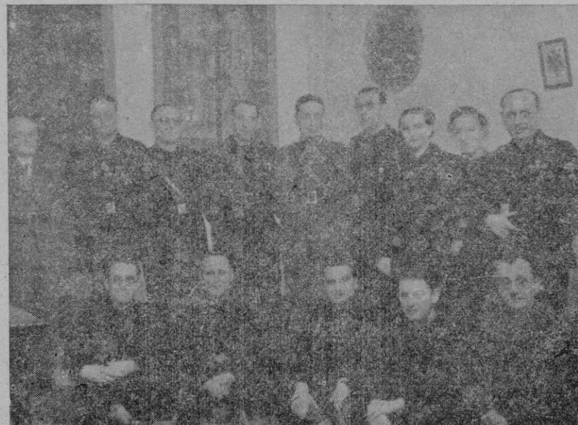
LA DELEGADA NACIONAL DE AUXILIO SOCIAL CON LOS JERARCAS DEL PARTIDO