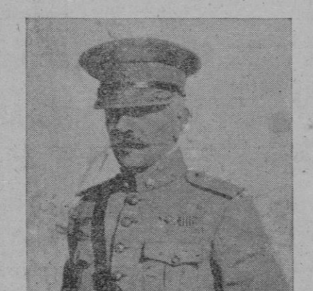
Ayer cumplió años el General Cermona, Presidente de la República portuguesa.

Su pueblo festejó dignamente la efeméride, dando pruebas fehacientes de la profunda penetración que tiene con la persona y con la política del ilustre militar y estadista.