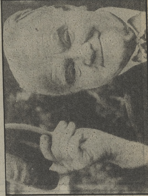
El ángel con la cara sucia de «Sesión de noche» es James Cagney