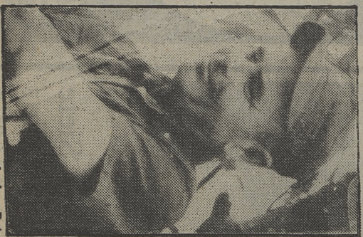
Glenn Ford se pasa toda la «Primera sesión» medio en un submarrino