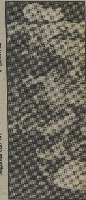
Todos los de «La luz de los justos», con sus amigos de la iglesia